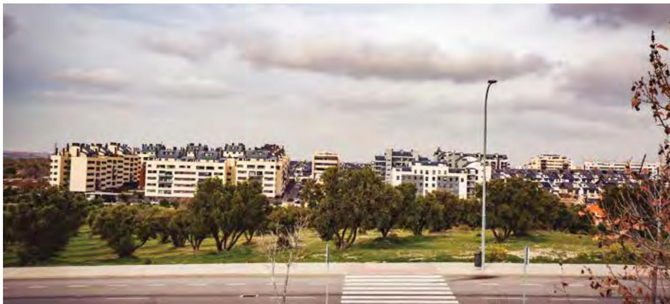
El olivar de La Partija es uno de los espacios verdes donde actuará el proyecto Renatura Rivas.