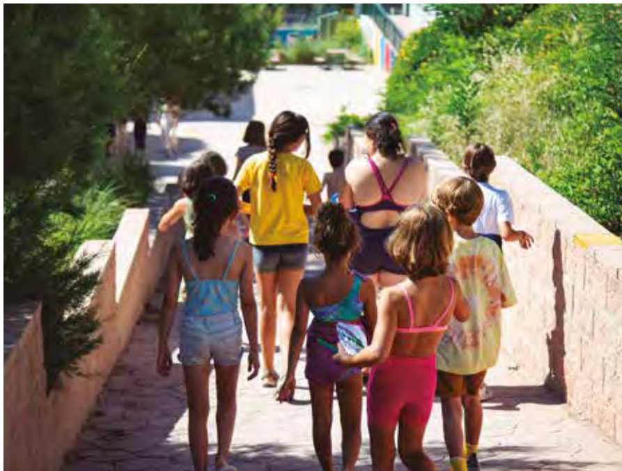
Campamento urbano durante el pasado verano de 2023, en el colegio Iturzaeta. PACO MARISCAL

FORMACIÓN Los campamentos urbanos en colegios, en julio y agosto, ofrecen la oportunidad para la fase práctica del curso