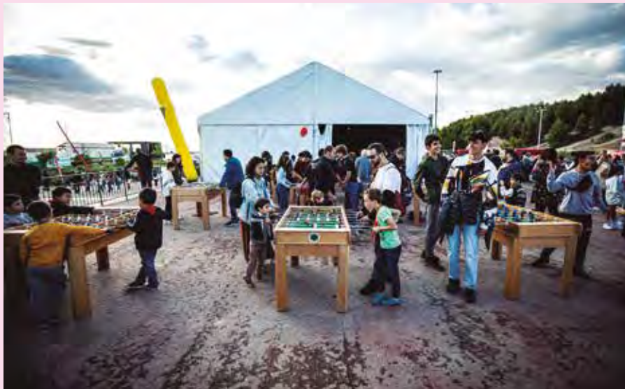
Zona de ocio infantil de 6 a 12 años, con futbolines y otros juegos para compartir. MARIO F. TREJO

DIVERSIÓN > Se dividen en tramos de edad (0-5 años y 6-12 años) y suponen una propuesta lúdica para compartir con otras niñas y niños