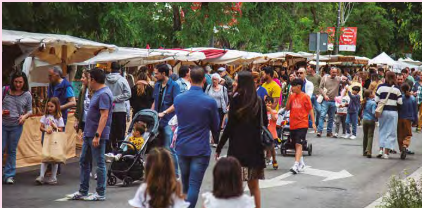
El mercado artesano de autor llena de puestos las calles de San Isidro y Miralrío del Casco Antiguo. PACO MARISCAL