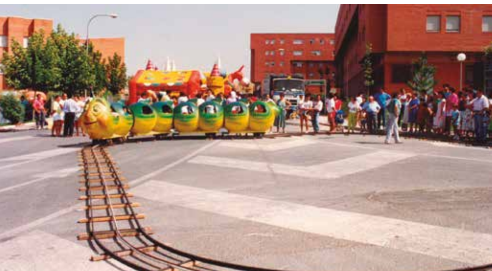
Fiestas de Covibar, 1989.

En ese estadio volvió a cantar en 2008, entre otros, Enrique Morente, 26 años después de aquel concierto de 1982 que abre este reportaje, y de la mano de Muchachito Bombo Infierno. Muchos de los niños y las niñas que pueden verse en las fotos de los ochenta estarían ahora en la primera fila de los conciertos. Ese año Rivas acogió el III Foro Social de Migraciones y la ciudad “volvió a ser la capital mundial de la diversidad humana”, como apuntaba el número de septiembre de la revista municipal. Por aquel entonces Rivas contaba con 65.000 habitantes y lanzaba un mensaje contundente: ‘Rivas, el mundo te mira’. Más de 500 voluntarios y voluntarias hicieron posible este Foro, en el que muchas familias ripenses pusieron sus casas a disposición como alojamientos solidarios.