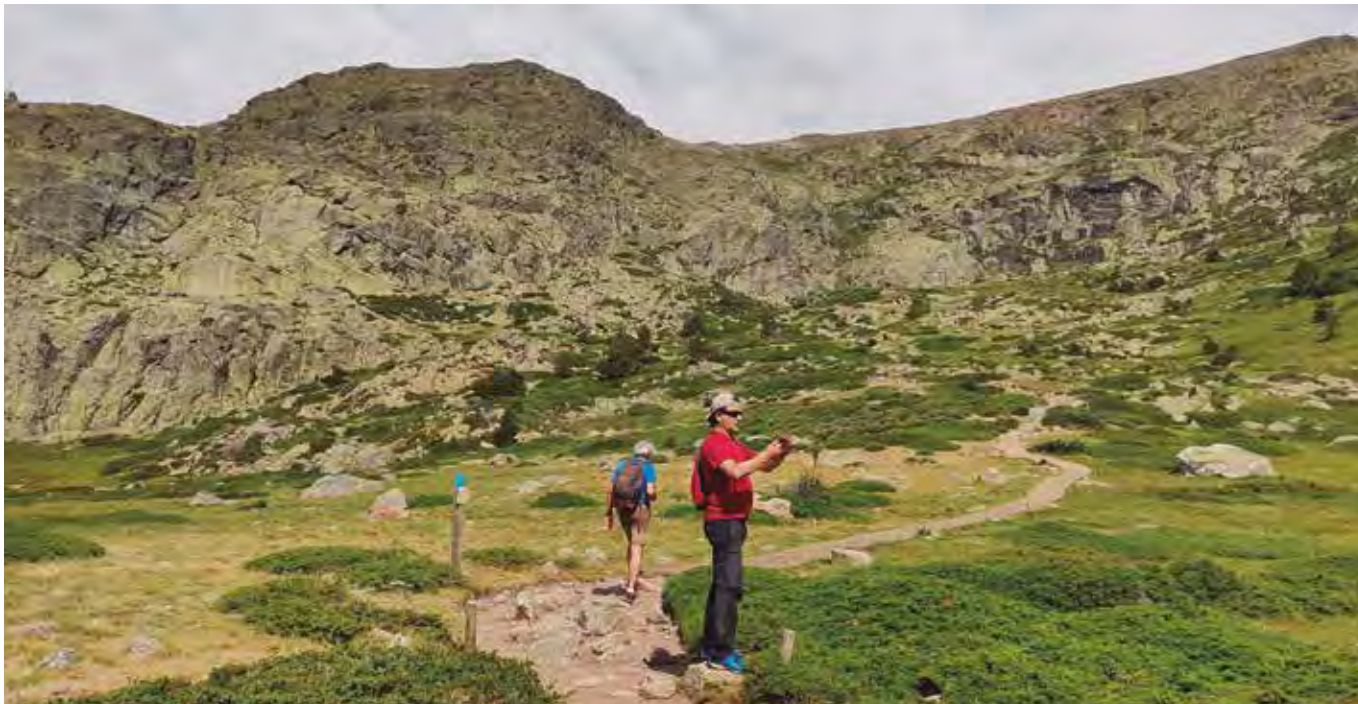
La salida de montaña en mayo explora el macizo de Peñalara. NACHO ABAD