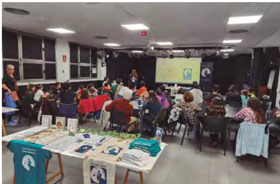
Una sesión de la Escuela de Creación Literaria, que organiza la asociación Verso Abierto.

TALLER ➤ Nueva sesión en abril de Escuela de Creación Literaria EscriVAs, que organiza la asociación Verso Abierto