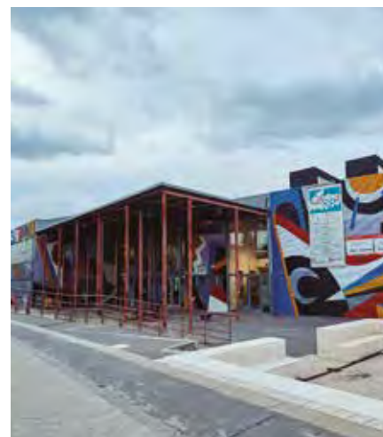
Entrada del Centro de Educación y Recursos para Personas Adultas (CERPA).

La ciudad cuenta, además, con cuatro bibliotecas: Gloria Fuertes (barrio Centro), Federico García Lorca (centro cultural homónimo, junto al Ayun-