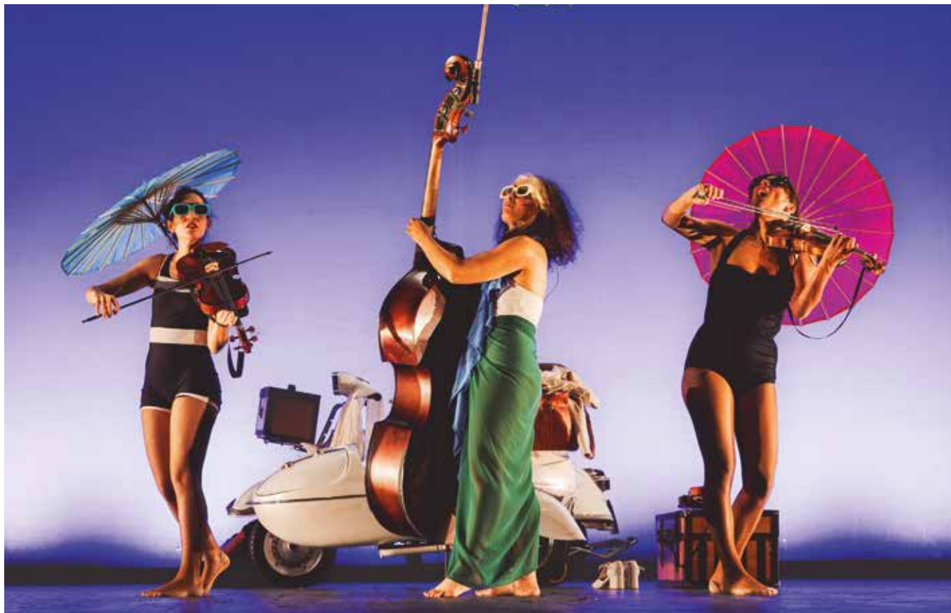
Las tres instrumentistas que protagonizan 'Galop', un viaje musical de la compañía La Jolie.