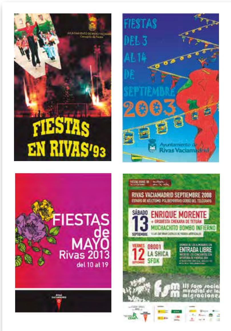
Carteles de fiestas en distintas ediciones.

sitúo a Rivas como referencia en el mapa cultural español y por la defensa de la memoria democrática. Son muchas las personas que recuerdan lo que significó en 2004 el homenaje a los republicanos y republicanas que sufrieron la Guerra Civil española y la dictadura franquista. 741 abuelos y abuelas de toda España y del extranjero se reunieron en Rivas Vaciamadrid el 25 de junio de 2004 para romper el silencio y ayudarnos a recuperar la memoria.