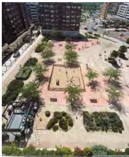
Vista aérea de la plaza de la avenida de Aurelio Álvarez cuyo nombre decidirá la ciudadanía.

Las propuestas deben ceñirse a unos criterios: nombres de personas ilustres de Rivas ya fallecidas, nombres de hechos históricos vinculados al municipio o nombres abstractos y evocadores. Los nom-