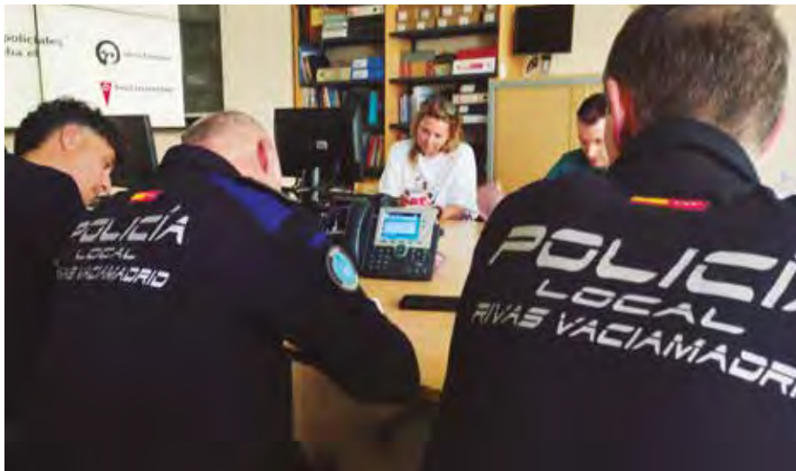
Miembros de la Policía Local de Rivas, durante la sesión el pasado abril.

IGUALDAD > Abordaron conceptos como 'sexting', las diferencias entre abuso y agresión o las novedades de la ley - En septiembre, nueva sesión con más miembros de la plantilla policial