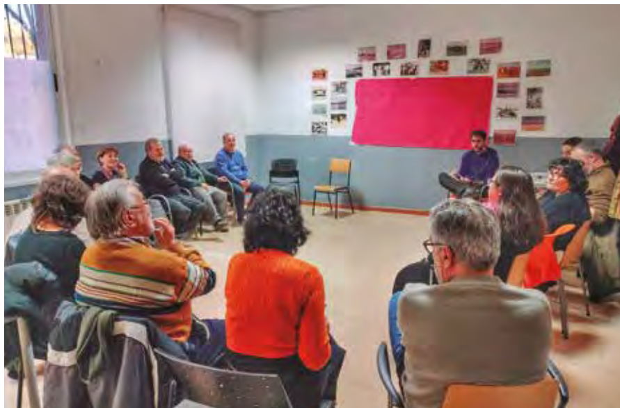
Participantes de la comisión Historia y Memoria del pueblo de Rivas Vaciamadrid.