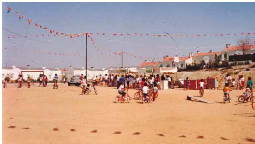
Fiestas de Covibar, 1989.