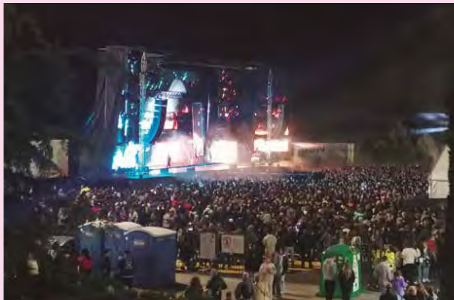
Un escenario en el recinto ferial acoge los conciertos de las orquestas de noche. MARIO. F. TREJO

CONCIERTOS > Tanto el recinto ferial, con un escenario levantado para la ocasión, como el parque de San Isidro (Casco) acogen recitales