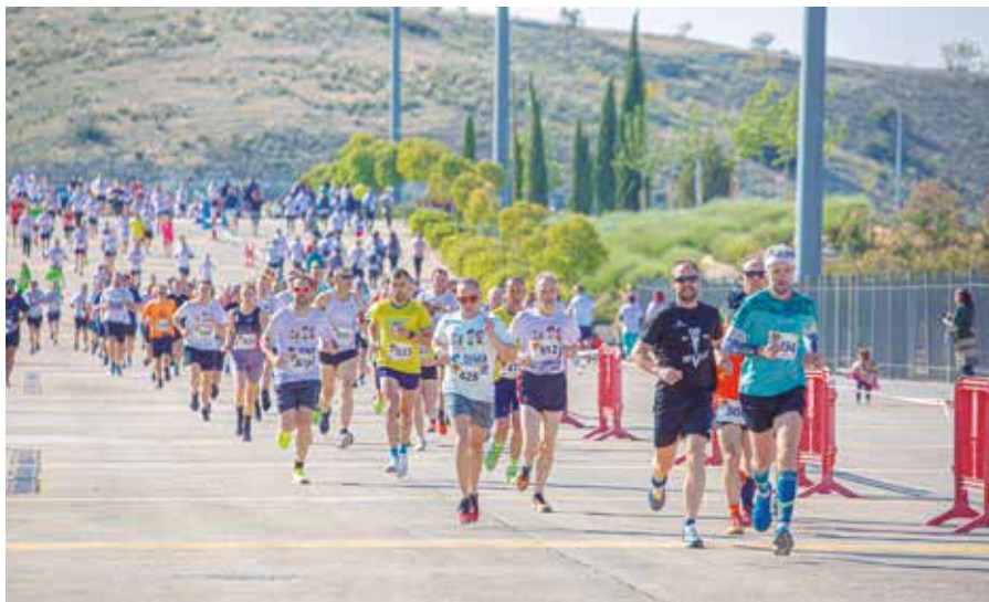
Participantes en la Legua Solidaria Rivas con el Sáhara de 2023. PUBLIO DE LA VEGA

CARRERA > La Legua Solidaria Rivas con el Sáhara cumple una década - El domingo 26 de mayo, cientos de personas vuelven a citarse