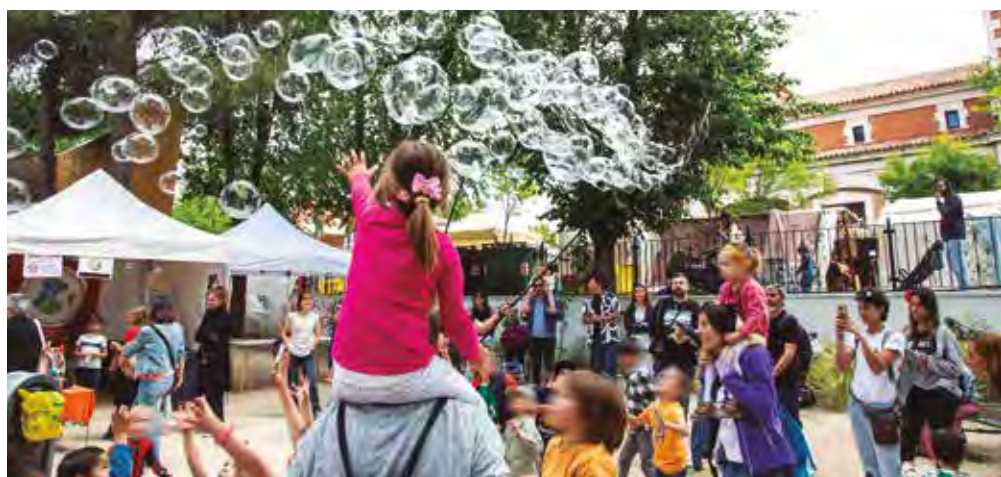
Fiestas en la actualidad, en el Casco y el recinto ferial.

que sitúa de nuevo a Rivas en el mapa de eventos más importantes de la Región. Rodrigo Cuevas, Arde Bogotá, Ginebras o el Festival Solidario Grimey por Palestina son solo algunos ejemplos. Unas fiestas a la altura de una ciudad que siempre ha entendido la cul-