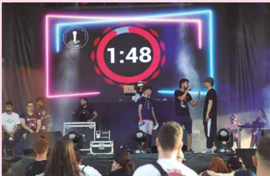
Un momento del Rivas Sound de las fiestas de 2022. PUBLIO DE LA VEGA

CONCIERTOS > El espacio sonoro cambia a un mejor emplazamiento y programa artistas locales de rock, punk, latin urban, hip hop, rap y DJs