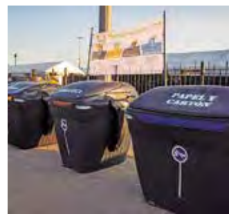
Contenedores en el recinto ferial, en las fiestas de 2023. P. MARISCAL

ración de Alimentos de Rivas (RRAR), recogerá el pan sobrante de las casetas de las fiestas de mayo. Después, ese pan será enviado para alimentación de animales de granja.