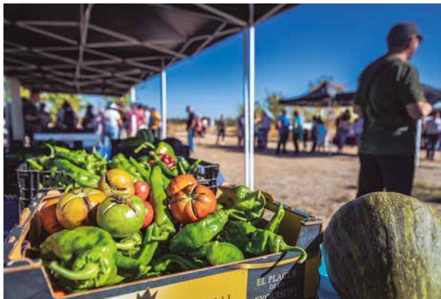
Alimentos cosechados en el parque agroecológico, en una jornada de huertas abiertas. MARIO F. TREJO

SOSTENIBILIDAD > El espacio de 72 hectáreas, creado en 2012, fue el primero de gestión municipal de España