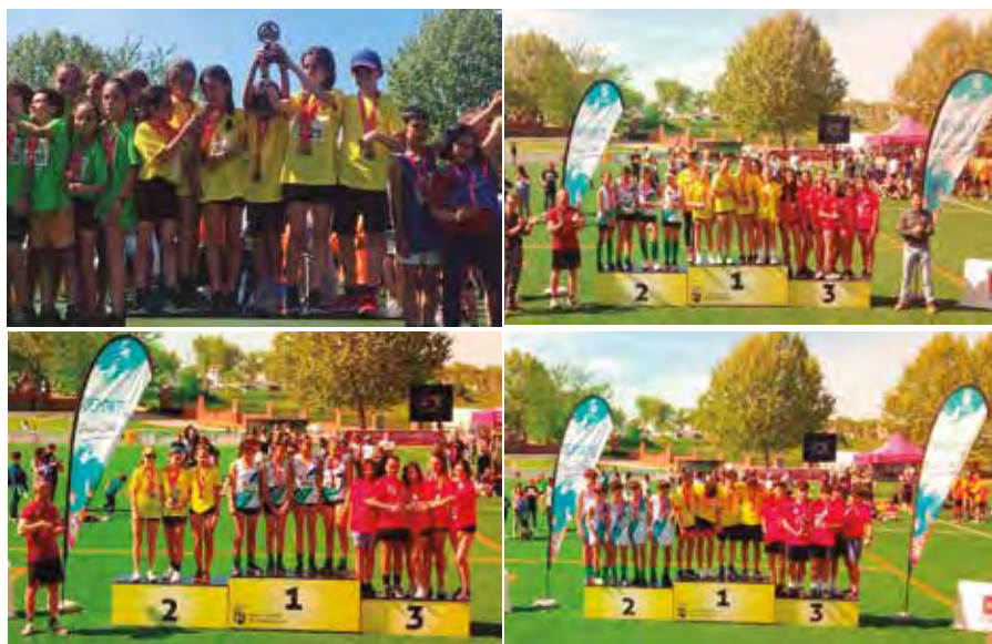
Arriba: los equipos benjamín mixto de segundo año y el infantil femenino, ambos campeones. Abajo: el cadete femenino, plata; y el cadete masculino, campeón.

CROSS > Sobresaliente actuación estudiantil en la cita madrileña celebrada en Navalcarnero, con varias subidas al podio