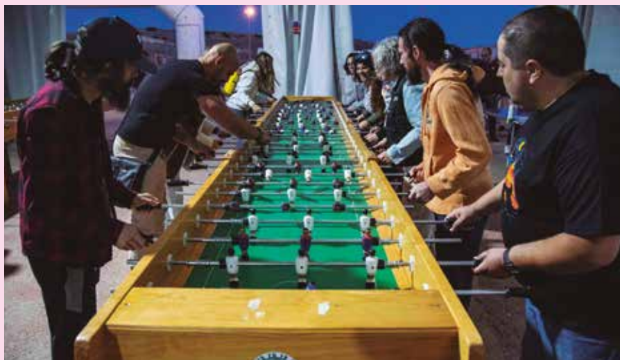
En la zona de ocio joven, las propuestas son variadas y muchas para disfrutar en equipo. P. MARISCAL

RECINTO FERIAL > Las noches del miércoles 15 al sábado 18 de mayo, se abre un espacio para jóvenes, de 22.00 a 02.00