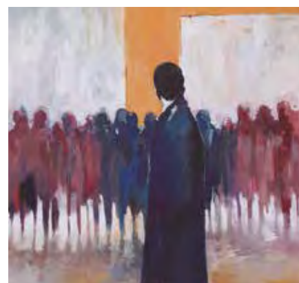
El cuadro 'Si yo pasara hambre'.

La muestra incluye códigos QR para que el visitante pueda escuchar los poemas a la vez que observa los cuadros. El proyecto se ha materializado en exposiciones (con anterioridad en Albacete, Chinchilla de Montearagón y El Bonillo) y la publicación de un libro (Editorial Vitrubio).