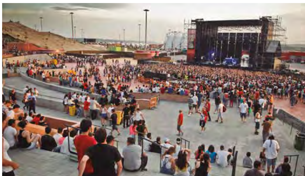
Auditorio Miguel Ríos.