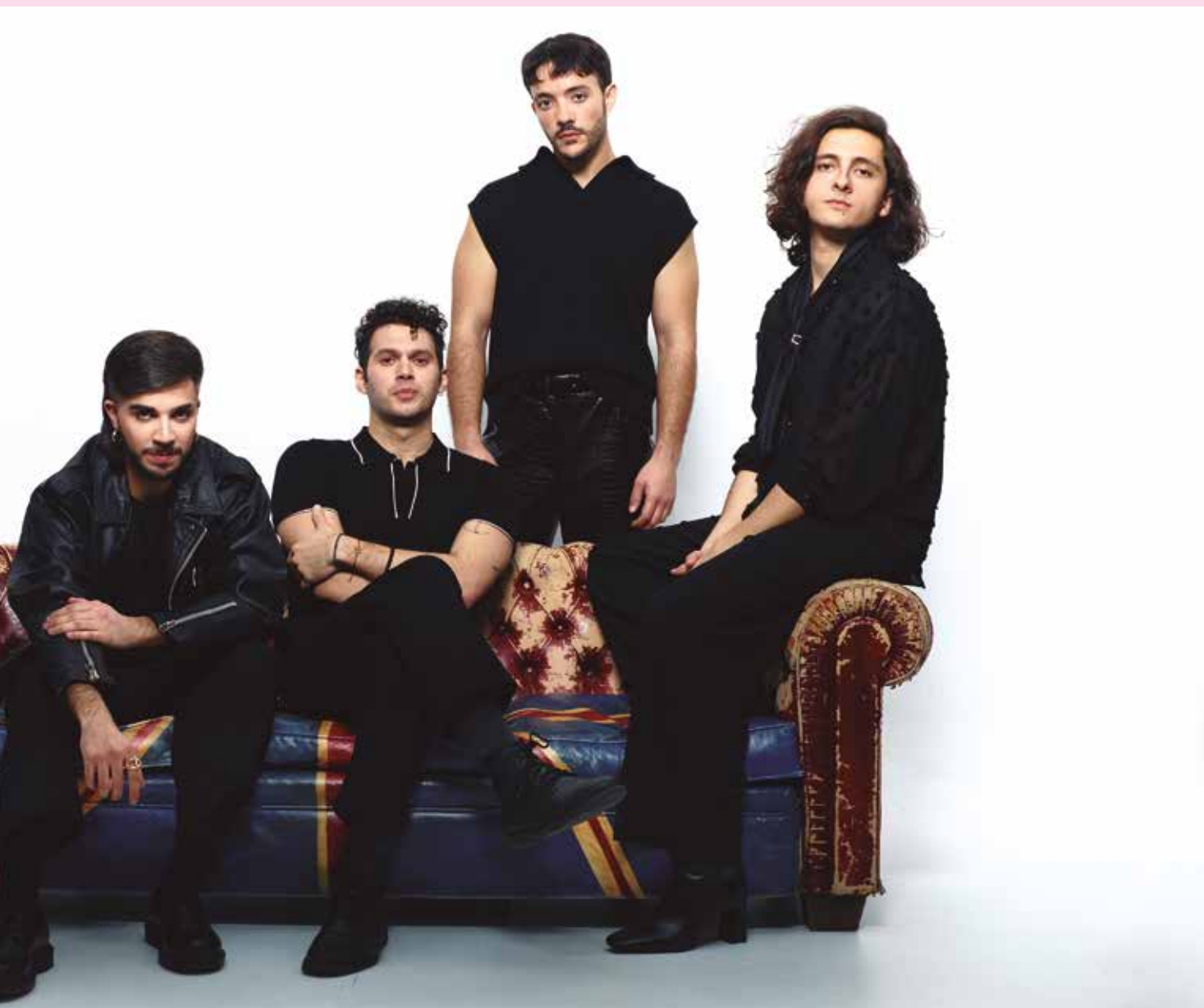
Arde Bogotá es una de las bandas más pujantes del panorama musical actual. El miércoles 15 de mayo actúan junto a Ginebras y Carmesí.

Llenar el Wizink Center en un par de horas dice mucho del momento que están viviendo. ¿Han sentido vértigo? Continuamente. Esa mañana [la mañana en que salieron a la venta las entradas del Wizink Center], por ejemplo. Al final son cosas desorbitadas que te ocurren y flipas. Hay que tratar de relativizar las cosas, ponerlas en su contexto y darles la importancia que tienen que tener. Y, sobre todo, convertirlos en ganas de hacer algo memorable que esté a la altura del esfuerzo que hace la gente.