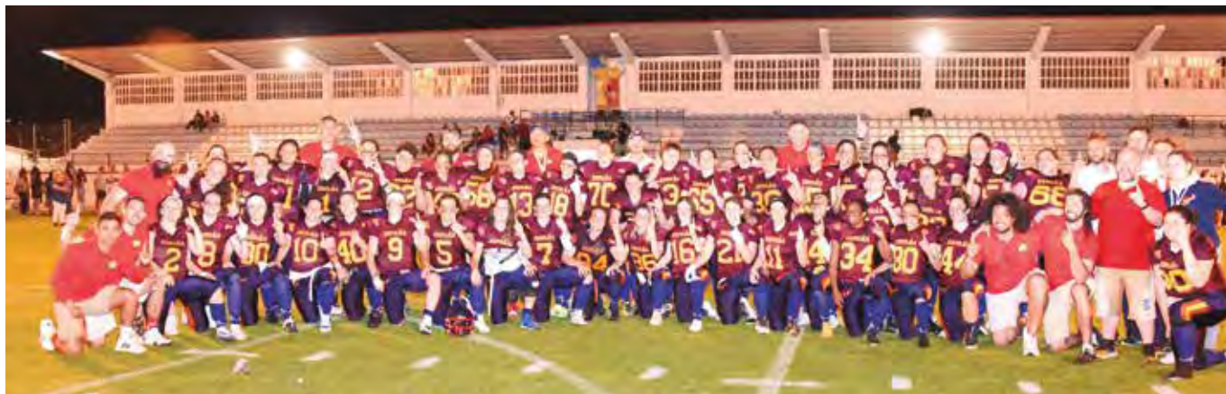
La selección española de fútbol americano, tras proclamarse campeona de Europa el 13 de abril en Calatayud (Zaragoza).