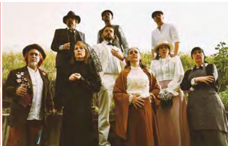
El grupo de teatro de la Concejalía de Mayores ('Hospital geriátrico El Caminito') y A Rivas el Telón ('El amor en los tiempos de Lorca').