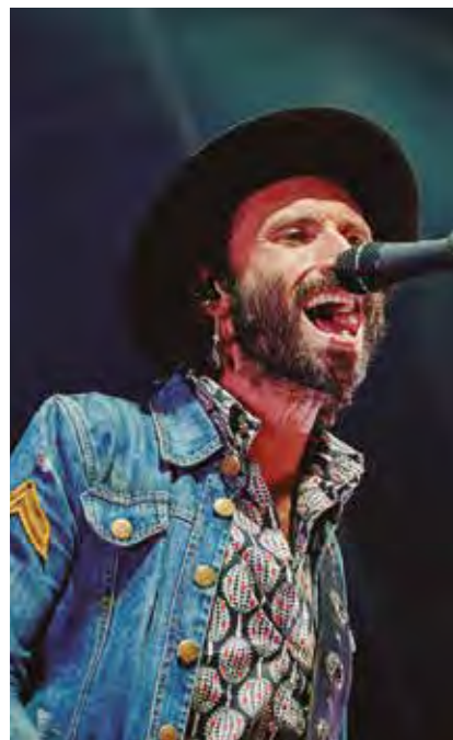
Vetusta Morla, Robe Iniesta, Rozalén, Mala Rodríguez, Naty Peluso y Leiva

“novedad” de Mojo Proyect. También tocó Sober. Ese mismo año se reformó la glorieta de Rivas Oeste para mejorar la conexión con la A3, tal y como se conoce hoy.