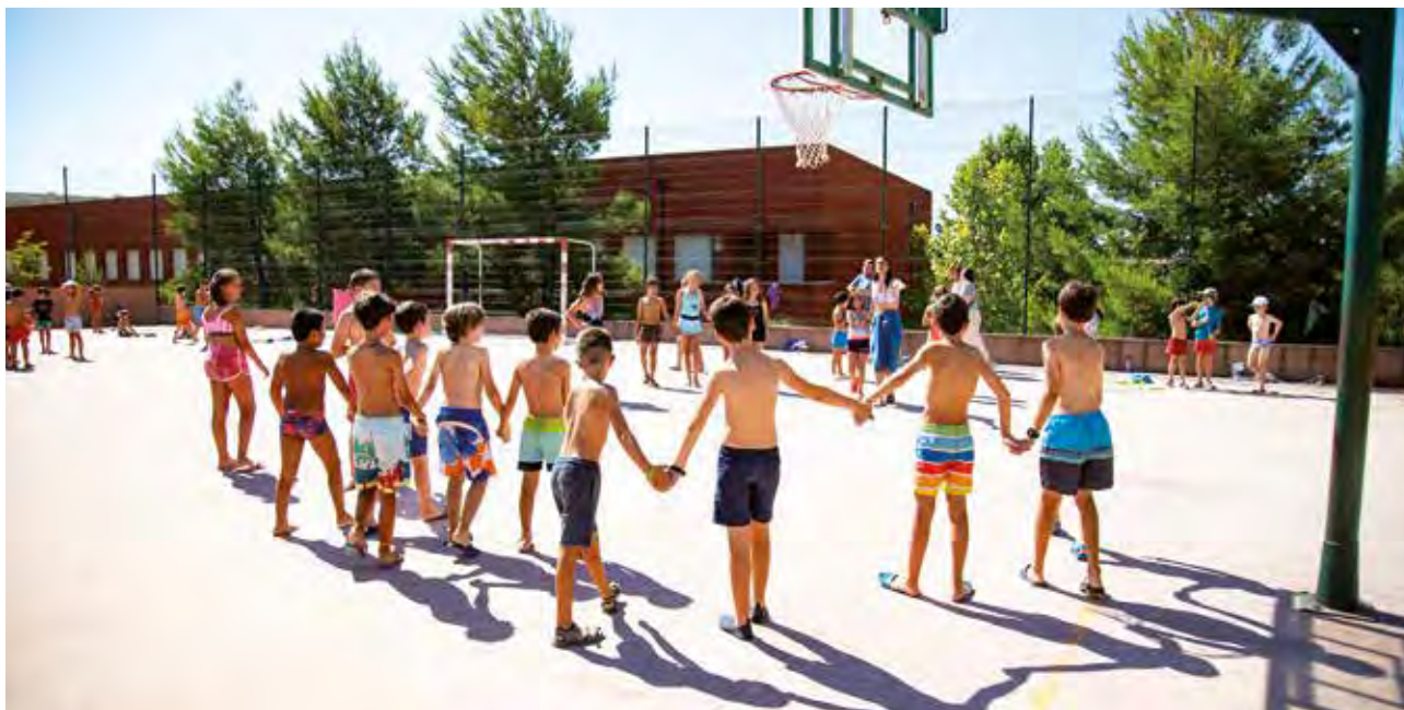
Una actividad lúdica durante un campamento urbano en 2023, en el colegio José Iturzaeta.