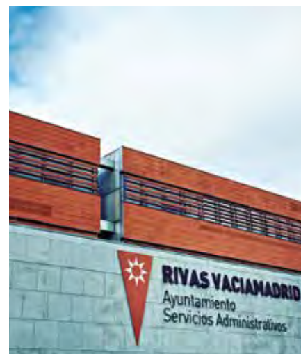
Los contratos serán de ocho meses.

El objetivo pasa por reforzar sus competencias profesionales y su activación en la posterior búsqueda de empleo.