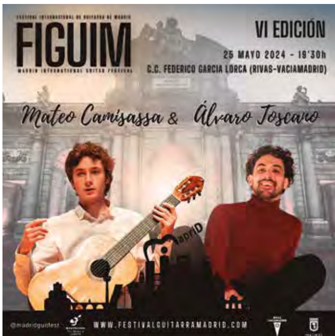
Carteles con los guitarristas que tocan en Rivas el viernes 24 y sábado 25 de mayo. Ambos recitales, en el el centro cultural García Lorca (3 euros).