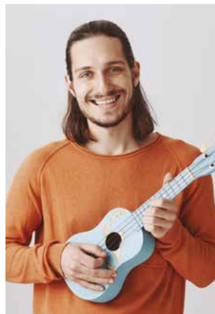
Este mes, ukelele el miércoles 29.

Actividad para quienes les guste tocar el ukelele pero no tengan con quien o deseen practicar en grupo. No es necesario tener un nivel concreto. "Saber tocar tres o cuatro acordes es suficiente para poder participar".