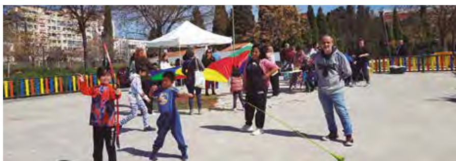
Una pasada edición de Viviendo el barrio, en el parque de Rafael Canogar.