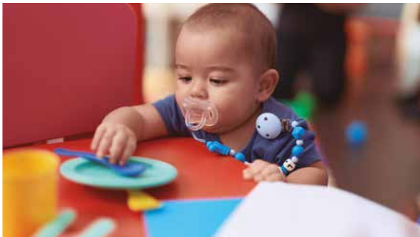
Bebetecas y pequetecas son espacios idóneos para trabajar hitos del crecimiento.