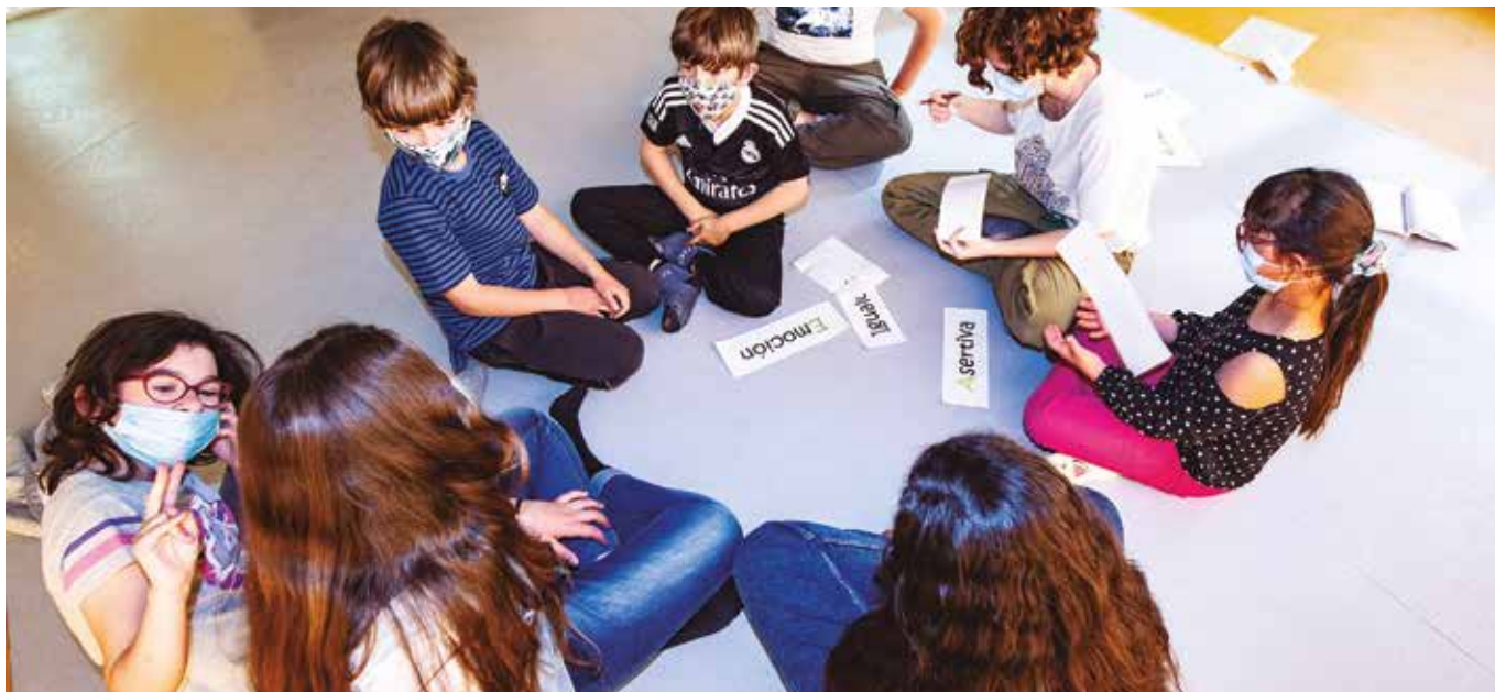
Una actividad del Foro Infantil, en mayo de 2021. MARIO F. TREJO