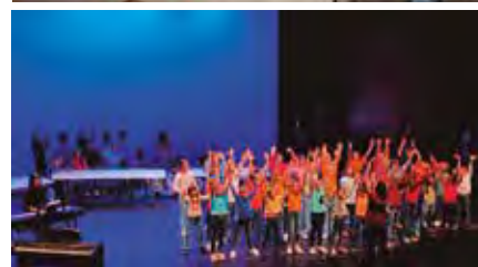
El trío de chelos Istrice, el conjunto de violines y el alumnado infantil de educación vocal, todos de la Escuela Municipal de Música.

Sebastián Tanus Molina. Un concierto de una hora media de duración.