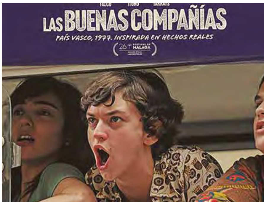
Cartel promocional de la película que se proyecta el viernes 10 de mayo.