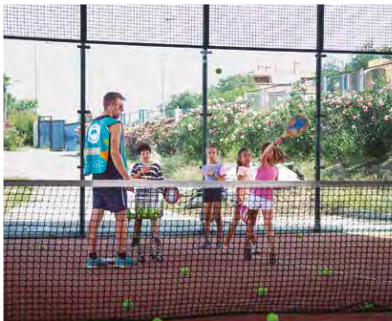
Tenis en una de las colonias deportivas del pasado año.