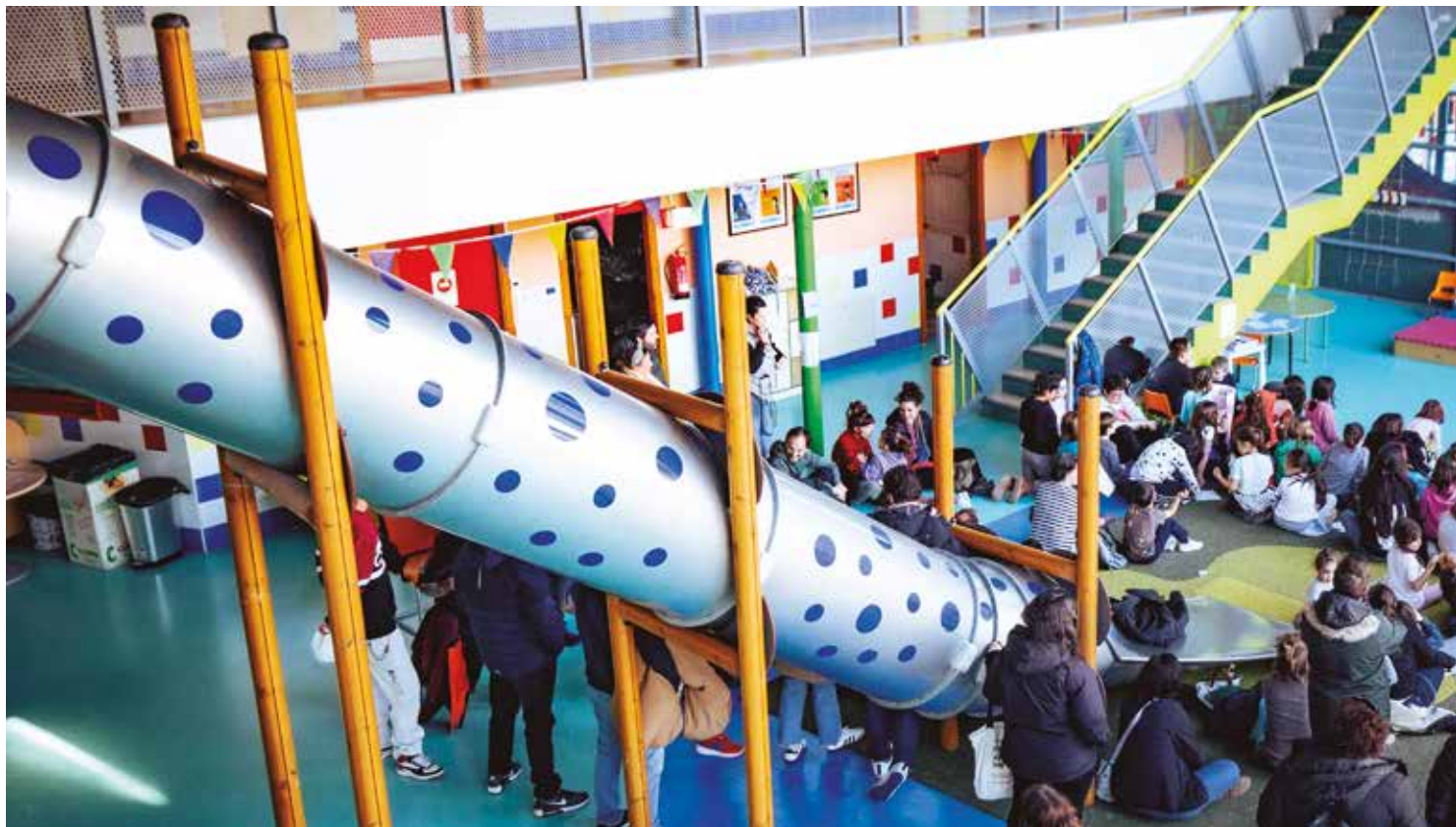
Con permiso del centro Rayuela, el Bhima Sangha alberga el tobogán más famoso de Rivas. MARIO F. TREJO