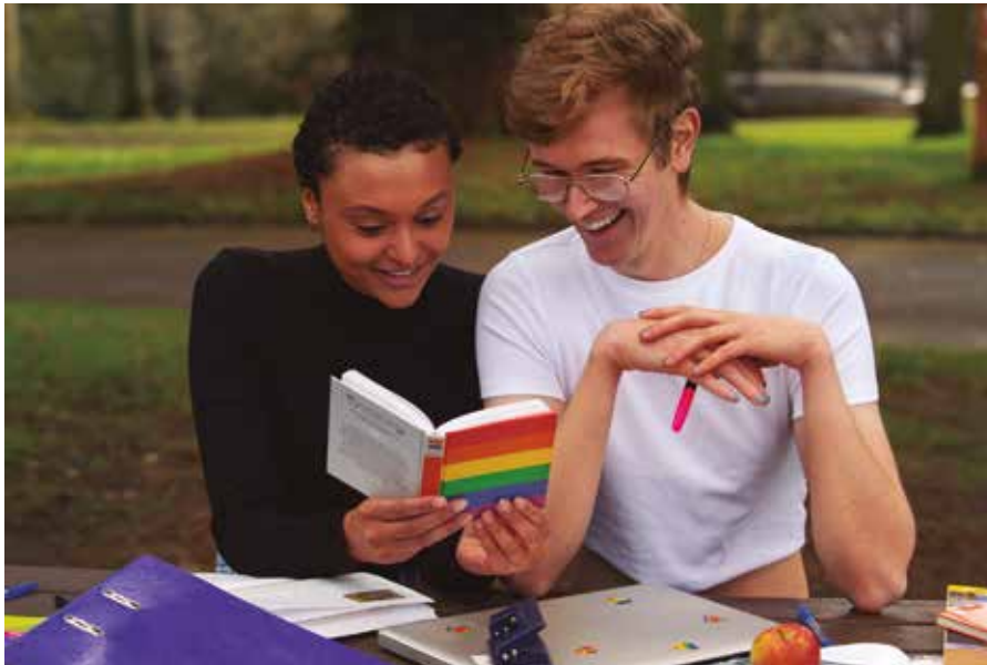
La iniciativa se enmarca en las actividades por la Semana del Orgullo LGBTI de Rivas.