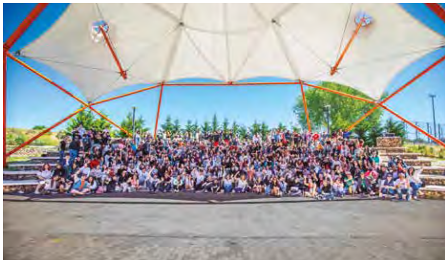
Alumnado participante en el encuentro de institutos, el 17 de abril en La Casa+Grande.

EDUCACIÓN ➤ Desde 2016, se organiza una cita para que el alumnado que participa en el programa municipal de convivencia comparta experiencias y conozca la realidad de los otros centros