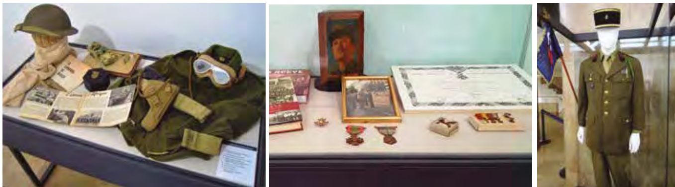
Objetos que se pueden contemplar en la exposición 'La Nueve', comisionada por la Asociación Histórico-Cultural Los Cosacos de La Nueve.