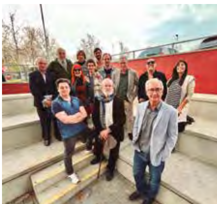
Integrantes de la asociación Escritores en Rivas.