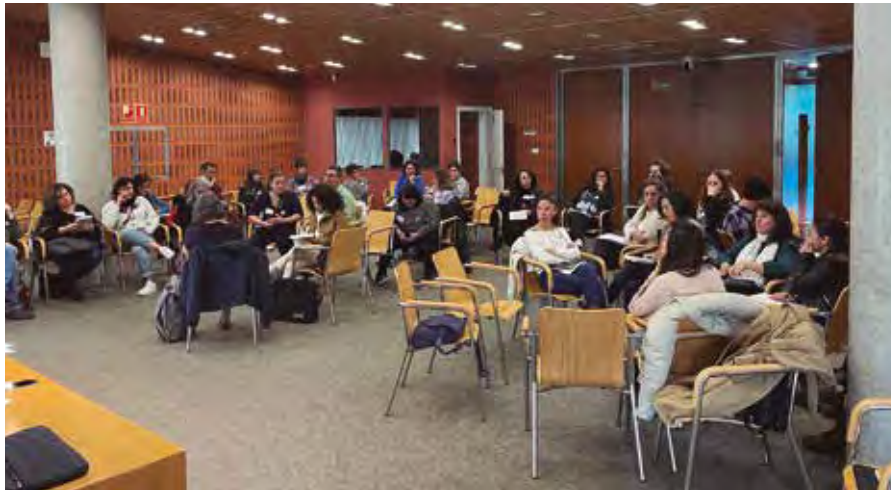
Momento del encuentro interprofesional celebrado en la sala Pedro Zerolo del Ayuntamiento

CUIDADOS> Más de 40 profesionales de distintos ámbitos participan en una sesión en el Ayuntamiento