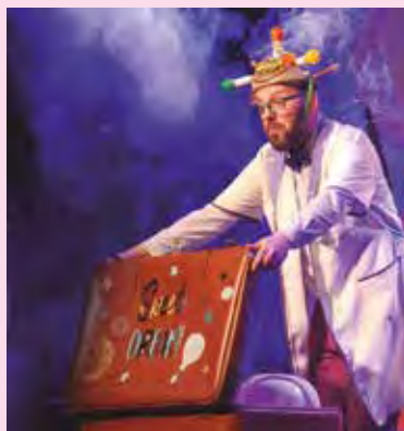
Los diez espectáculos se reparten en dos espacios: los teatrales se representan en la calle de San Isidro (Casco Antiguo); los que llegan en formato concierto, en el escenario del recinto ferial.