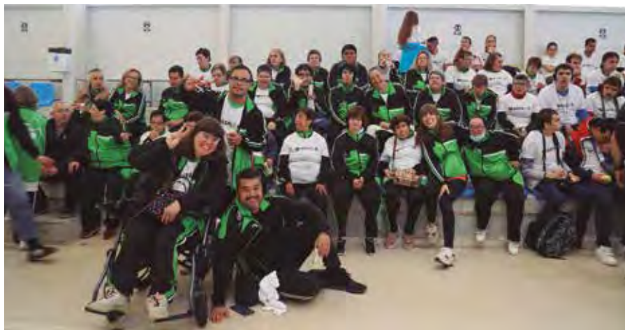
Participantes en la carrera por la Integración de 2023.

DISCAPACIDAD > El evento reúne a alumnado de los centros de educación especial y a personas de centros de atención de todo Madrid