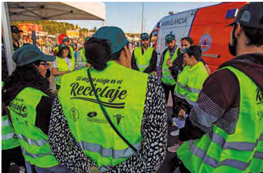
El grupo que divulga sobre la necesidad de mantener unas fiestas limpias, en 2023. PACO MARISCAL