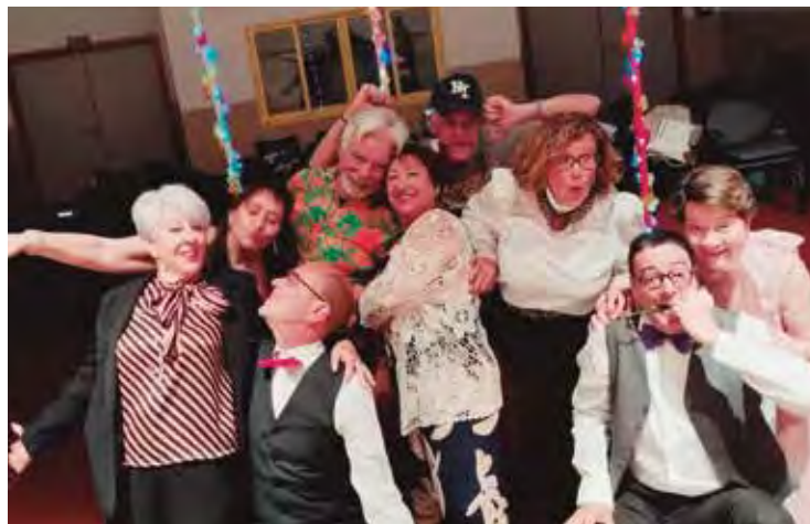
Las dos compañías de la Universidad Popular: Origen y Comienza Teatro ('Zarzuela en la corrala') y Sueña Teatro ('La gran fiesta').