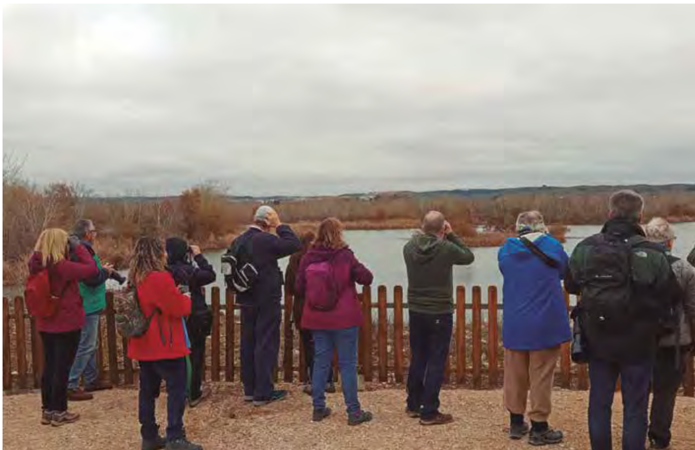
Participantes durante una pasada visita al entorno natural de la antigua finca agrícola de El Porcal. PEA