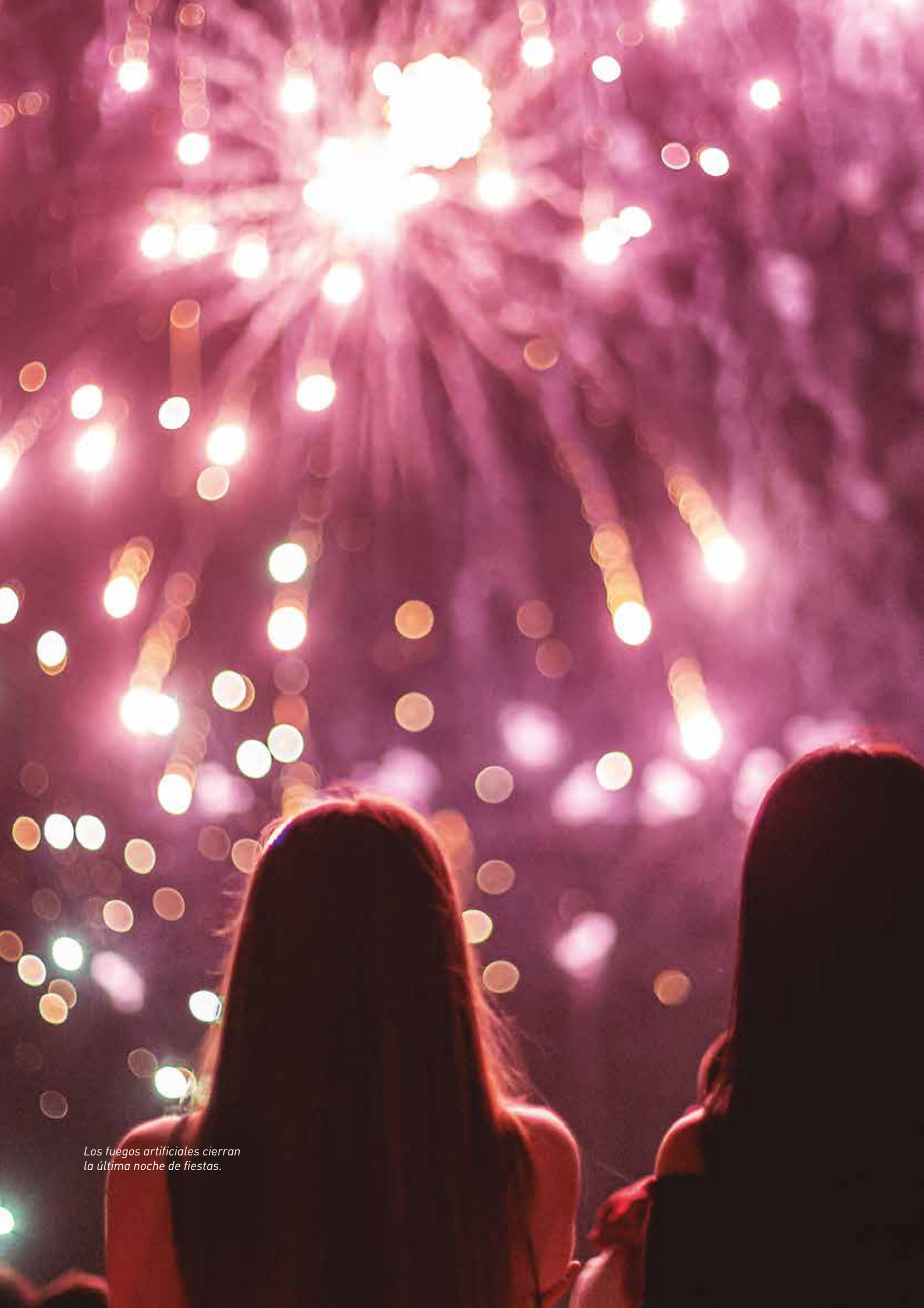
Los fuegos artificiales cierran la última noche de fiestas.