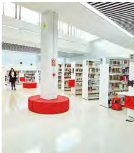
Interior de la biblioteca municipal Gloria Fuertes, construida en 2018. LUIS GARCÍA CRAUS

En préstamos, se realizaron 87.922 de materiales físicos (un incremento del 6,75%) y 13.962 digitales (un 70% más). Las bibliotecas, que juntas suman una superficie de 2.1541 metros cuadrados, cuentan con 434 puestos de lectura y 25 de internet. Disponen de un fondo bibliográfico físico de 89.670 ejemplares (libros y material audiovisual) y de un fondo digital de 23.033 títulos (ebook, audiolibros o películas).