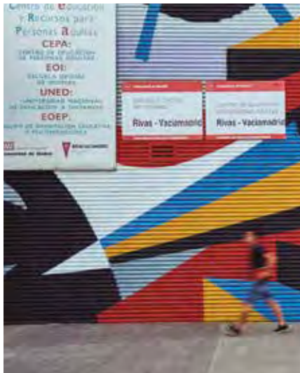
La Escuela Oficial de Idiomas se encuentra en el CERPA. L.G.C.

Además, la EOI de Rivas es un centro acreditado Erasmus+: "Participamos