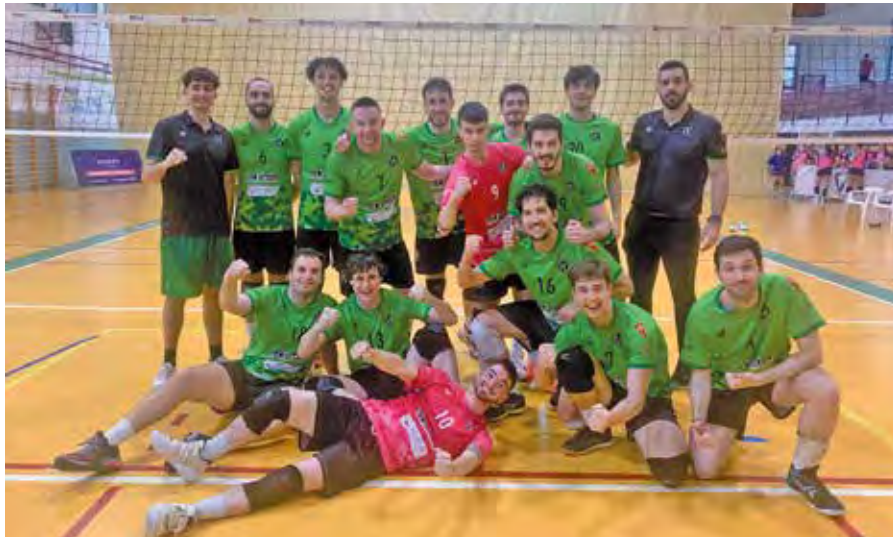
El equipo masculino de la AD Voleibol Rivas, tras conseguir el ascenso a Superliga 2.