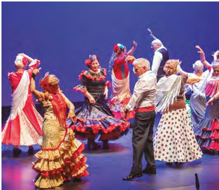
Exhibición de baile en la Semana de Mayores de 2023. P. DE LA VEGA