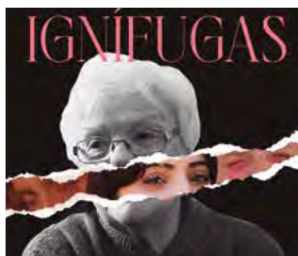
Cartel del documental 'Ignífugas'.

En esta última entrega se proyecta el documental 'Ignífugas', firmado por nueve mujeres y que reco-