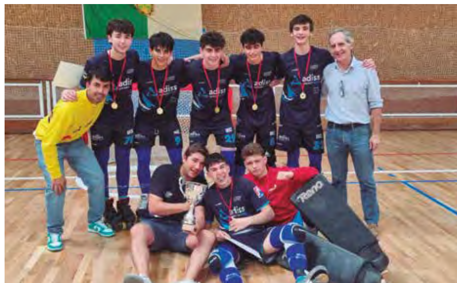
El equipo juvenil de Rivas Las Lagunas, con la copa de campeones de Madrid.

Al cierre de esta edición, el equipo sénior masculino se había clasificado por tercera temporada consecutiva para la final de la Liga Nacional, reeditando el choque de 2022 y 2023 con Las Rozas Black Demons. El año pasado se impusieron los roceños. Y hace dos temporadas, los ripenses. De ganar la nueva final (sábado 4 de mayo), Osos alzaría su tercer título liguero, tras los de 2001 y 2022.