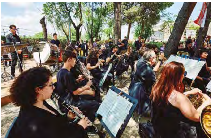
La Escuela Municipal de Música cuenta con diversas agrupaciones, como la banda de música.