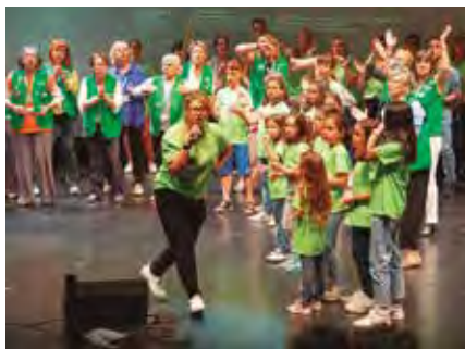
Un concierto anterior contra el cáncer.