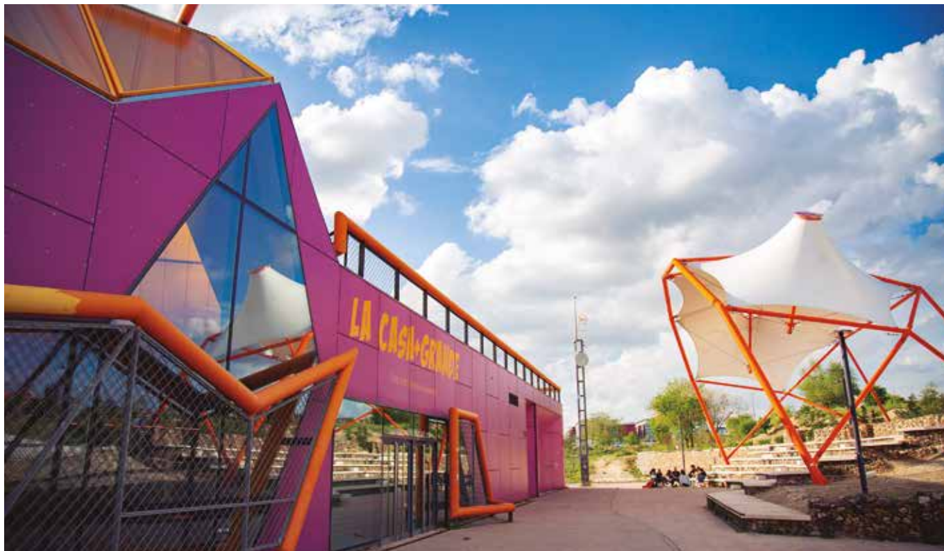
Epicentro de la actividad juvenil del municipio, con amplias salas y espacios que se ponen a disposición de distintos proyectos.