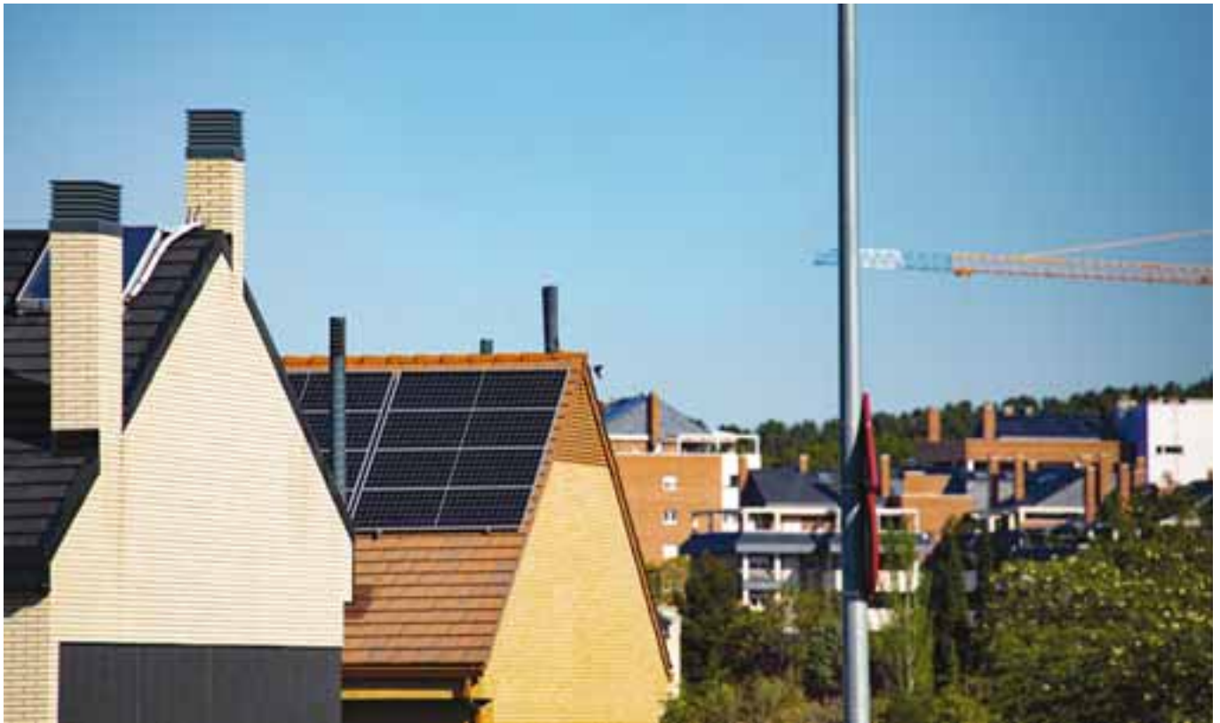
Los paneles solares empiezan a coronar los tejados de muchas viviendas de Rivas Vaciamadrid. MARIO FDEZ TREJO