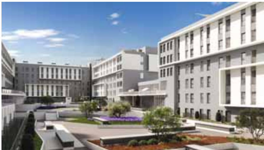
Infografía del conjunto residencial Be Casa, en la zona de Rivas Futura.

La idea en la que se basa este nuevo modelo es combinar "las ventajas de