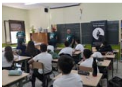
Integrantes de Verso Abierto, en una visita a un aula de un centro educativo.

El próximo recital es el jueves 10 de noviembre, a las 20.00. Se puede acudir a recitar o simplemente a escuchar. Más información en el correo verso.abierto@gmail.com