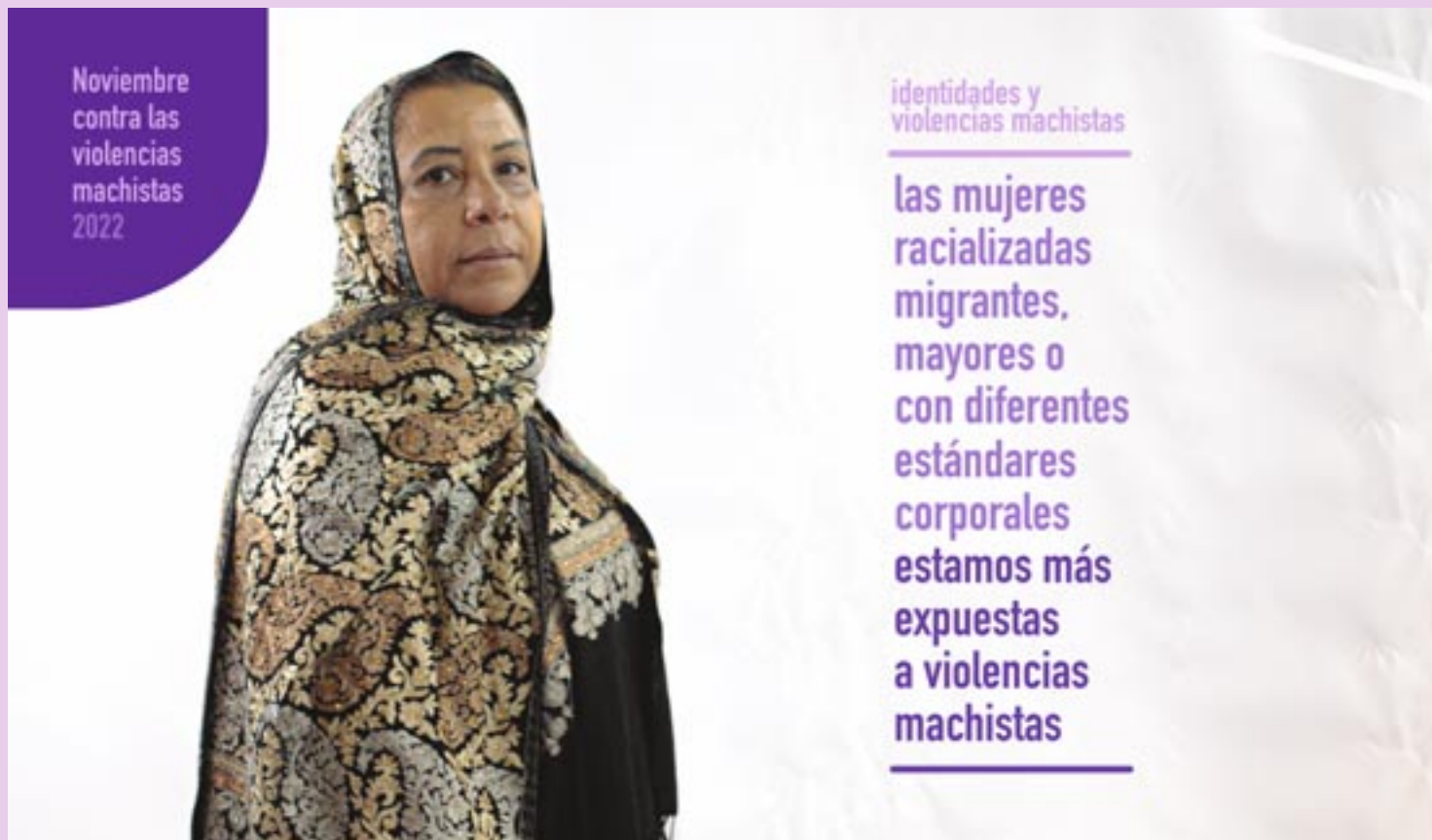
Izquierda: cartel de la campaña con las tres mujeres de Rivas que representan los ejes analizados. Derecha: una actividad de la campaña de 2021.