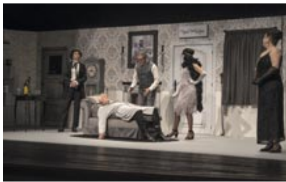
Las compañías Ateatro ('Don Quijote en los infiernos') y Gargallada ('Un desastre de función').

que, mediante favores y obsequios, tratarán de hacerse un hueco en su testamento y heredar su fortuna. El público no deja de sorprenderse con los giros de guion de la obra. Avaricia, engaños, traiciones, secretos y justicia bailan en esta comedia.