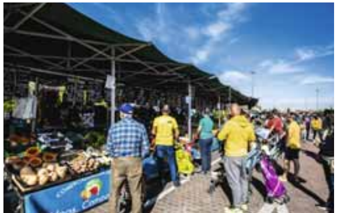
Diversos momentos del Mercado Central, el pasado domingo 16 de octubre. MARIO FERNÁNDEZ TREJO