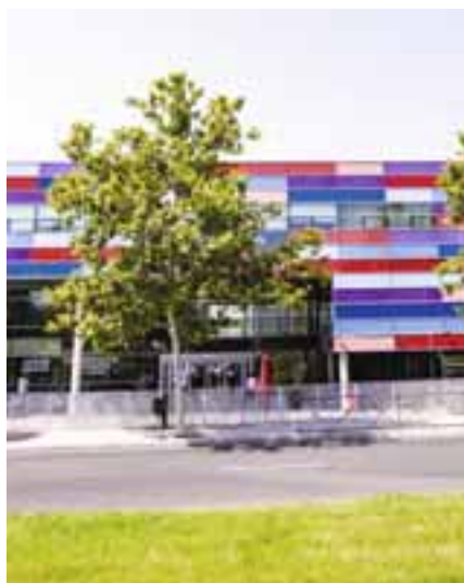
La nueva Oficina de Transformación Comunitaria, en el edificio Atrio, sucede a la anterior de transición energética. M.F.T.

Las ayudas a la financiación o la solicitud de subvenciones también se incluyen en el catálogo de prestaciones. Y no se dejan por el camino los servicios que venía prestando hasta ahora, vinculados a la instalación de placas solares en comercios y hogares y de otros sistemas colectores de energía menos