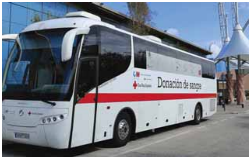
Autobús de Cruz Roja para la donación de sangre.