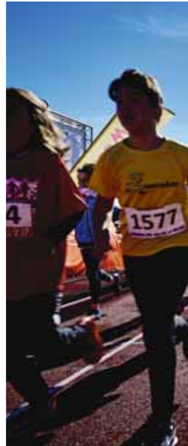
La Concejalía de Deportes hace coincidir los 10 kilómetros de Rivas (en la foto de la izquierda, podio femenino de una edición anterior) con el primer cross escolar de la temporada. LUIS GARCÍA CRAUS