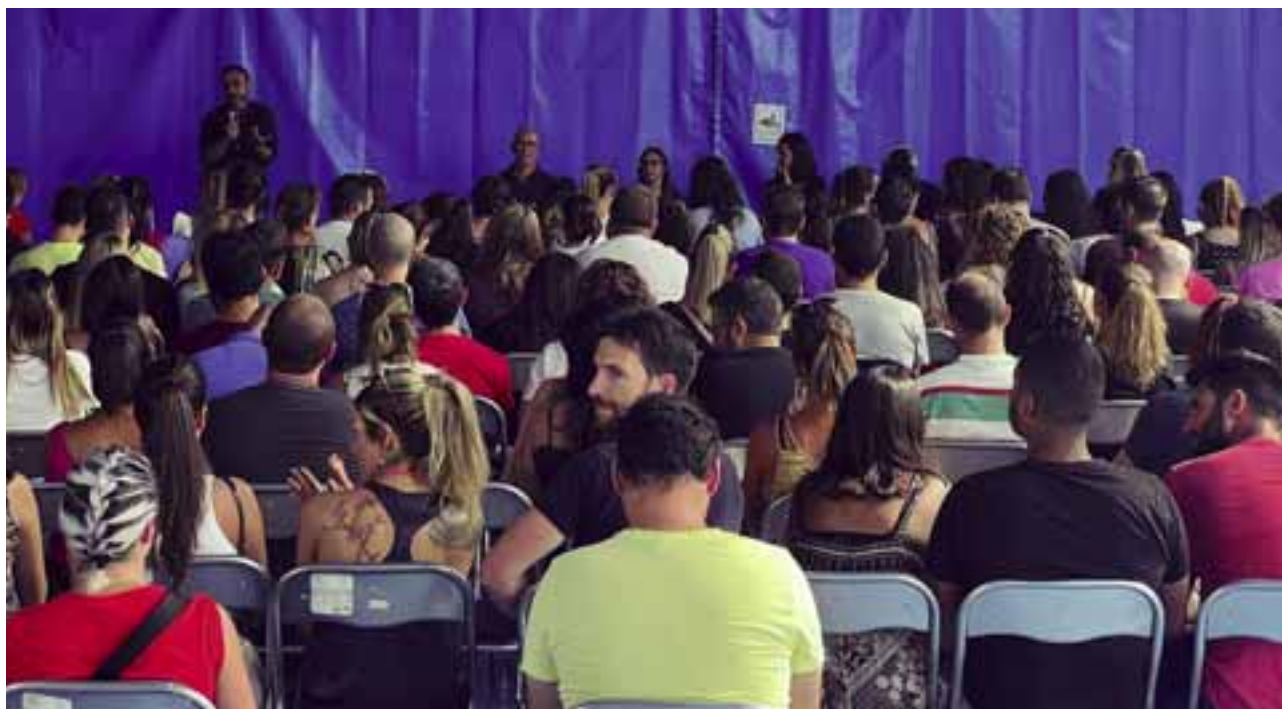
Presentación de la nueva escuela infantil municipal Pippi Langstrom.

urbanas, impulsaremos el uso de la bicicleta, mejoraremos la seguridad vial en nuestros pasos de peatones o profundizaremos en la Administración electrónica. Seremos, de hecho, junto a Barcelona, la única ciudad en todo el país con una herramienta telemática con la que la ciudadanía podrá relacionarse con el Ayuntamiento. Seguiremos, en definitiva, construyendo una ciudad más moderna y más accesible.