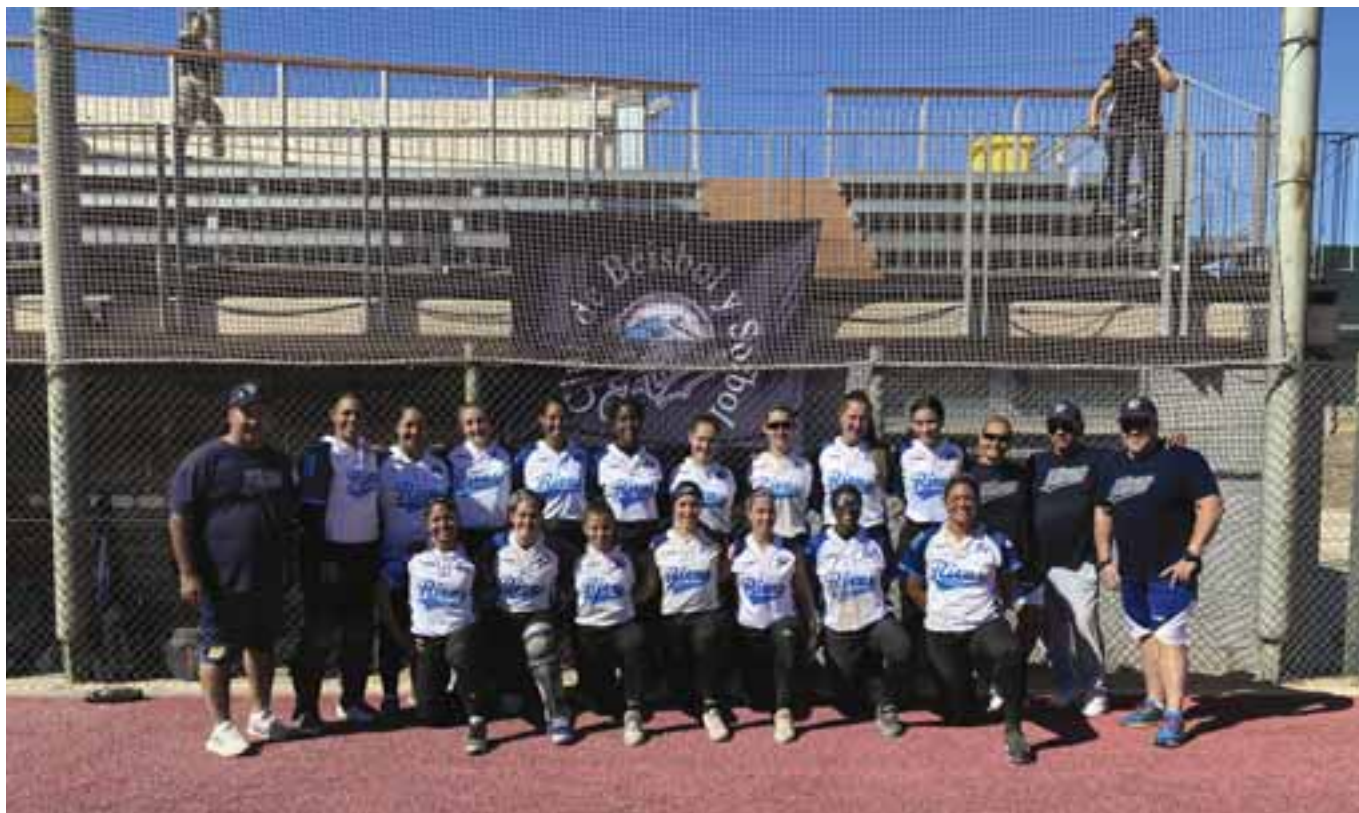
La plantilla del CBS Rivas, que ha ganado la liga nacional las últimas cuatro temporadas. LUIS OLIVA