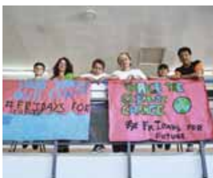
El CO2 que dejaron de emitir los centros equivale a la plantación de 51 árboles.

Siete de los diez colegios participantes han logrado reducir sus consumos de energía eléctrica, gas o agua. Entre los que han obtenido un mejor resultado, destacan El Olivar (17.138 euros), La