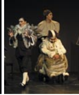
La compañía Sol y sombra representa 'Cuaderno para el uso de la Poncia y Bernarda'; Arte escénico y musical, 'Agnes de dios'; Teatro Enobras, 'Volpone'.