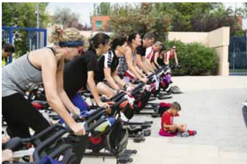
Los eventos de ciclo indoor están presentes en el calendario deportivo local. L.G.C.

Inscripciones: mismo método que para el primer cross escolar.