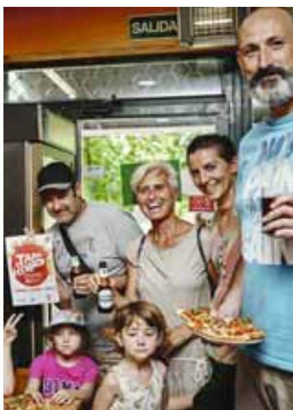
Las rutas gastronómicas suponen una ocasión estupenda para disfrutar en familia y con amistades. LUIS GARCÍA CRAUS

Ambos soportes se pueden encontrar en los establecimientos hosteleros