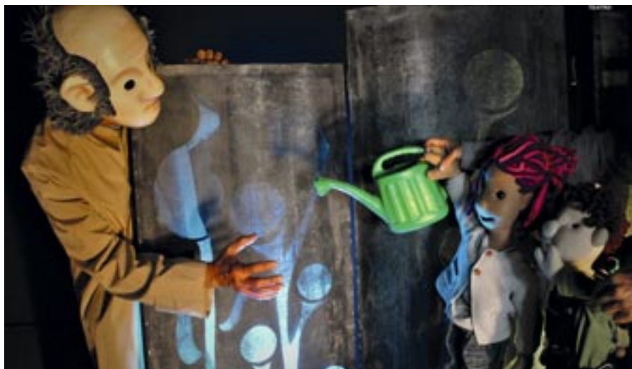
Teatro de marionetas en la sala Covibar. ÑAS TEATRO

TÍTERES → La sala Covibar acoge esta producción de Ñas Teatro para público familiar, el sábado 5, a las 12.00