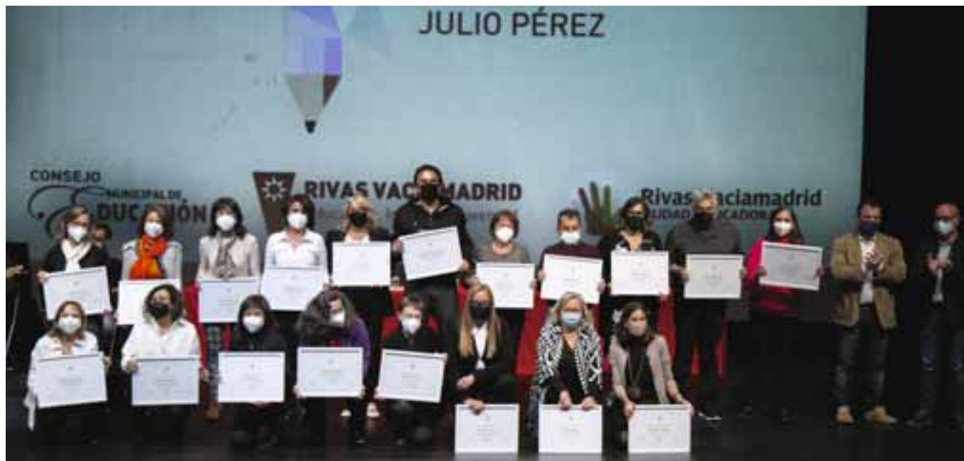
Algunas de las personas homenajeadas en la gala de 2021, en el auditorio Pilar Bardem. MARIO F. TREJO