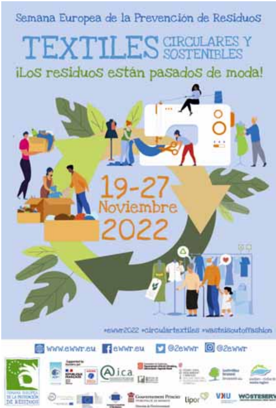
Cartel internacional de la Semana Europea de la Prevención del Residuo 2022.

MEDIO AMBIENTE → Rivas se suma a la iniciativa internacional con dos actividades: un coloquio sobre experiencias de éxito en la gestión de residuos textiles y un puesto en el Mercado Central