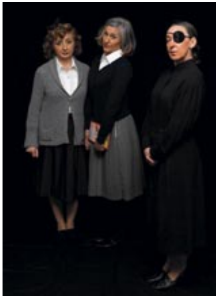
La compañía Maru-Jasp, que actúa con la obra 'El manual de la buena esposa'.

Los personajes de María Josefa (voz), Angustias (velo de novia), Martirio (corona de espinas), Amelia (abanico), Magdalena (pañuelo), Adela (rosa), la madre, cinco hijas de Bernarda y la criada (escoba) no aparecen en escena, y es a través de los personajes de Poncia y Bernarda como se pretende hacer una visión de la obra 'La casa de Bernarda Alba', de Federico García Lorca. "Es la primera vez que se lleva a las tablas esta arriesgada propuesta,