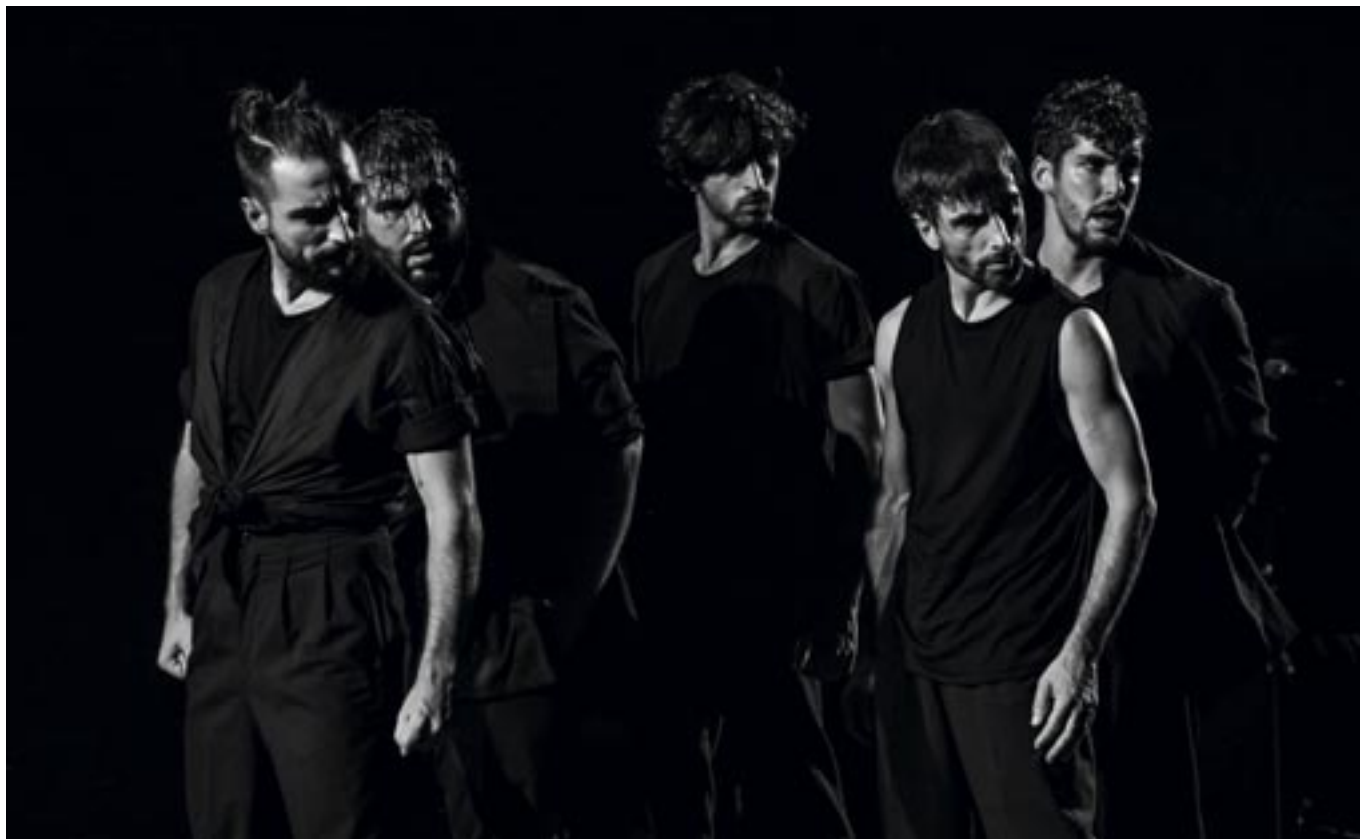
El elenco masculino de 'La confluencia', un espectáculo de danza creado por el dúo Estévez y Paños. BEATIX MEXI MOLNAR