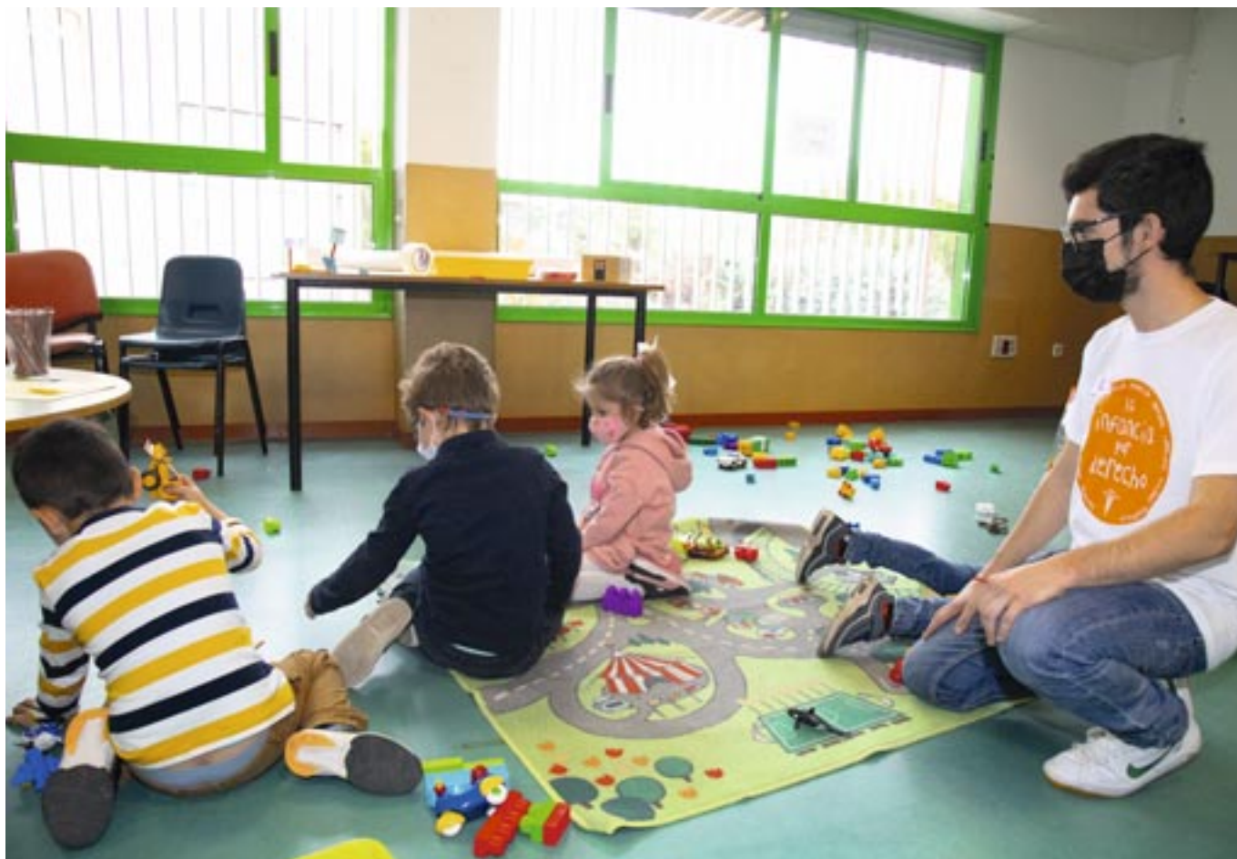
Las actividades del mes de la infancia tienen que ver con el articulado de la Convención de Derechos del Niño (y de la niña), de 1989. P.M.