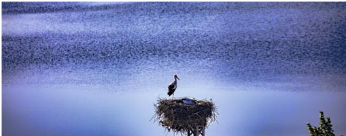
Una cigüeña, en su nido, en la laguna de El Campillo, por cuyos acantilados transcurre la ruta del sábado 26 de noviembre. MARIO FERNÁNDEZ TREJO