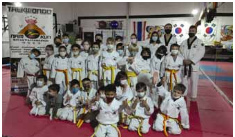
Alumnado de taekwondo en Rivas, una modalidad que en Corea es deporte nacional.

Un fin de semana intenso sobre el tatami. Rivas acoge el campeonato de España de taekwondo, hapkido y korean semi contact el sábado 12 y domingo 13 de noviembre, en el que se estima la participación de 300 combatientes. La cita está promovida por la Federación Española de Artes Marciales Coreanas y Deportes Asociados.