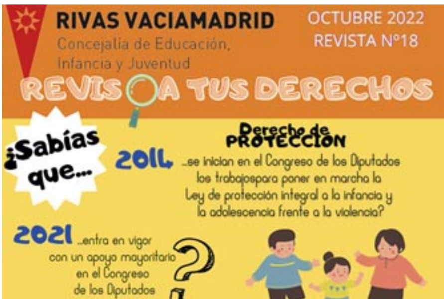
Portada del pasado octubre. Se pueden consultar todos los ejemplares en rivasciudad.es

ONLINE → Cualquier niño o niña puede mandar sus fotografías, cartas o dibujos, este mes, sobre los derechos de la infancia