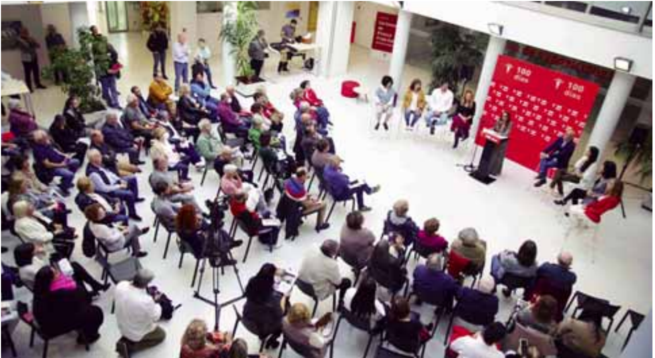
Público asistente al acto de los 100 días como alcaldesa.

a sus hijos e hijas en los barracones que tanta gracia le hacen al consejero de Educación de la Comunidad de Madrid.