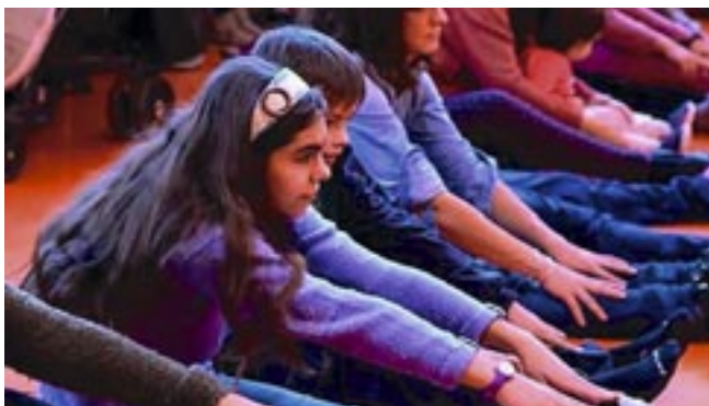
Clase de interpretación de la escuela en La Casa+Grande.

Envío de materiales: hasta el 25 de noviembre a infancia@rivasciudad.es . Puede participar cualquier persona menor de edad.