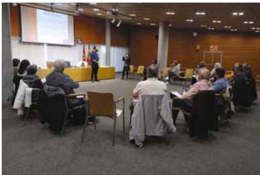
Una sesión formativa para las asociaciones de Rivas, en el Ayuntamiento.

En la línea de seguir ofreciendo formación gratuita al movimiento asociativo local, la Concejalía de Participación Ciudadana y Barrios está diseñando un nuevo curso de fiscalidad para entidades. Las fechas y horarios no se habían concretado al cierre de esta edición: se anunciarán en la web municipal ( rivasciudad.es ) y el perfil de Twitter del Ayuntamiento. En noviembre continúa también el curso sobre herramientas digitales, en el Instituto de Formación Marcelino Camacho (2, 7, 14 y 21 noviembre).