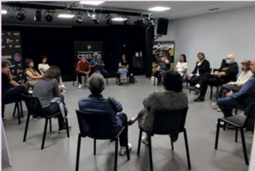
CineLab, el espacio mensual para personas aficionadas a las artes audiovisuales, también se suma a la campaña municipal contra las violencias machistas: proyección del corto 'Vacío', el martes 29.

Como cada año, Rivas se suma a las manifestaciones que recuerdan en todo el mundo el Día Internacional Contra las Violencias Machistas.