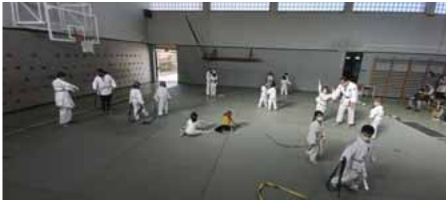
PUEBLO DE LA VEGA

JORNADAS ESCOLARES → Chicas y chicos nacidos entre 2007 y 2016 pueden probar ambas modalidades el sábado 26 de noviembre