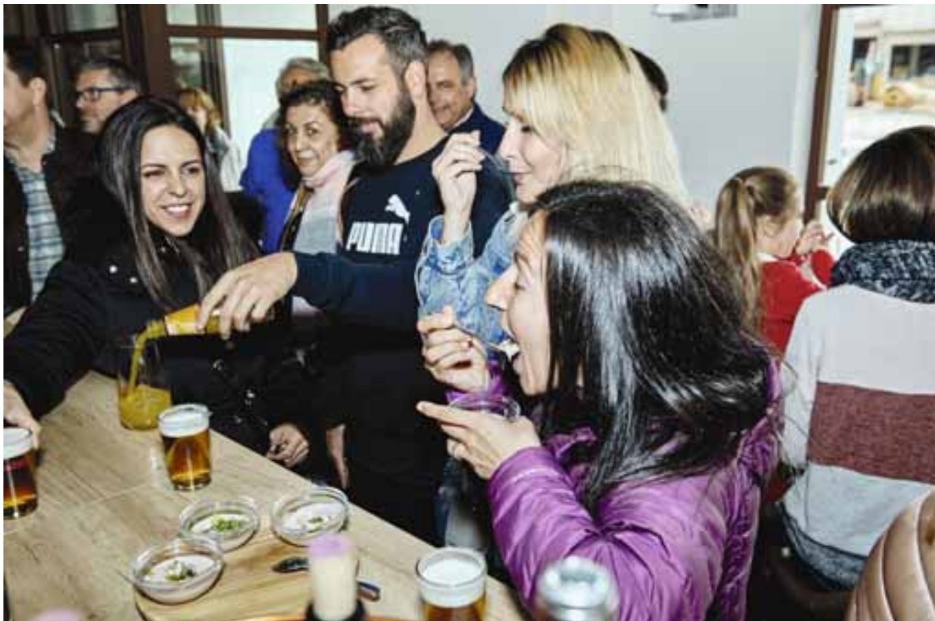
Las citas gastronómicas se suceden en la ciudad, con iniciativas culinarias como la 'Ruta de la tapa' y 'Guisos del mundo'. LUIS GARCÍA CRAUS