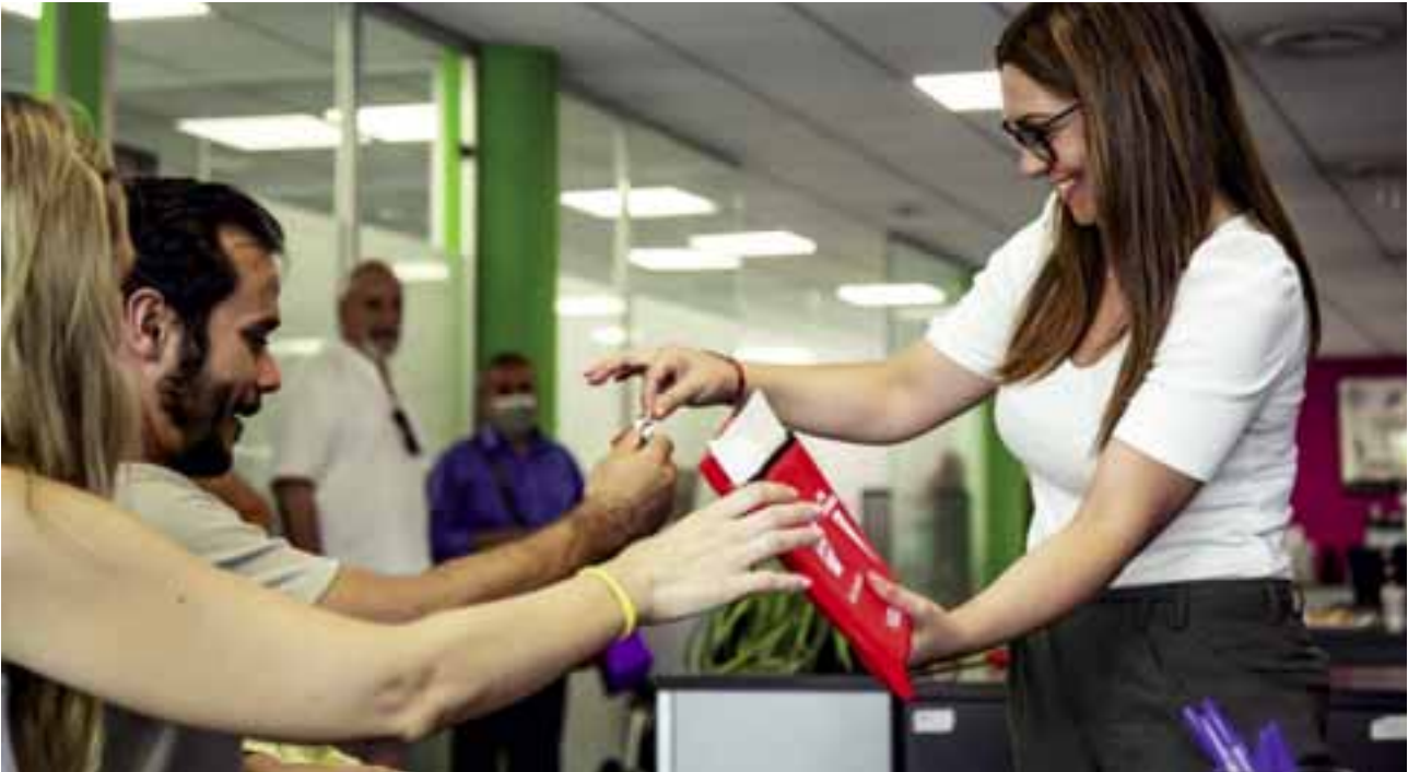
En Rivas se ha continuado entregando viviendas en alquiler a nuevas vecinas y vecinos.

La presidenta Ayuso, durante su discurso en el debate del estado de la región, hizo un listado de todos los centros de Salud que construiría la Comunidad en 2023 y no mencionó a Rivas. Esa deslealtad institucional con nuestra ciudad solo les califica a ellos como Gobierno, si bien afecta drásticamente a nuestra realidad sanitaria.