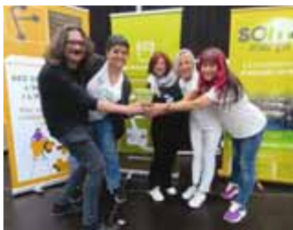
Representantes vecinales de La Pablo Renovable, en Barcelona.

El certamen, que alcanza su sexta edición, reconoce iniciativas ciudadanas que se esfuerzan por lograr una transición energética más ecológica, justa y democrática. El premio se entregó el pasado 22 de octubre en Barcelona, en la Feria de Economía Solidaria de Catalunya.