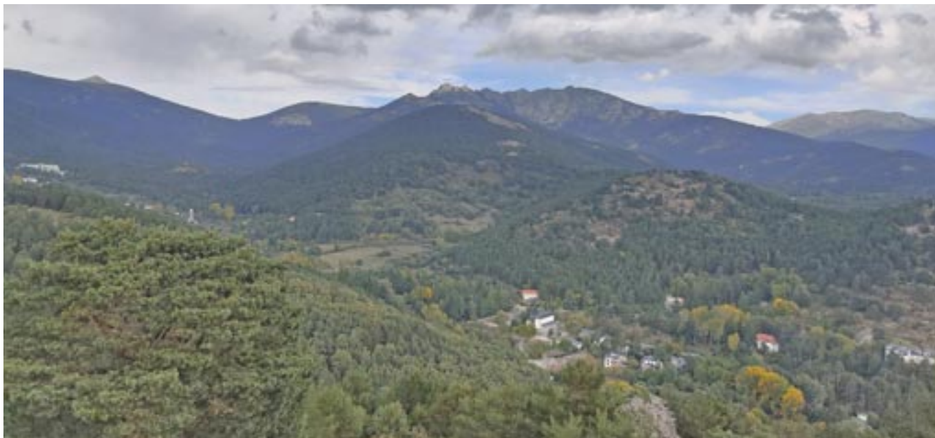
Vista del valle de la Fuenfría desde el cerro del Reajo Alto, en Cercedilla, el pasado 16 de octubre. I. ABAD