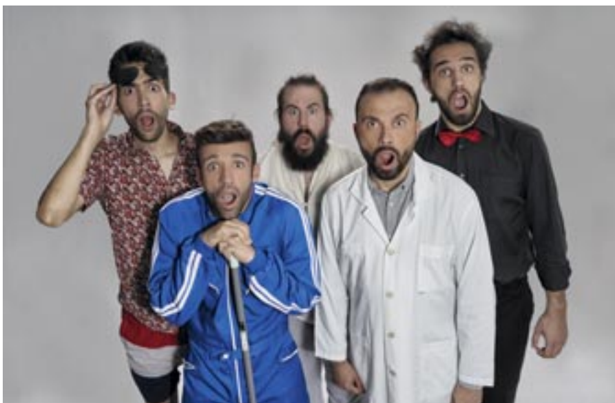
El grupo Dimensión Vocal, que canta a capela, ofrece su espectáculo musical 'Con la boca abierta'.

CONCIERTOS → El centro cultural Federico García Lorca se llena de actuaciones de la Escuela Municipal de Música el martes 22