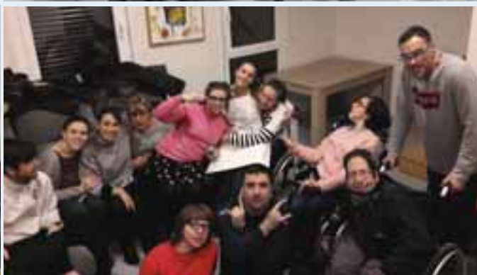
Diversos momentos vividos en la Casa Fundar, un espacio donde se comparten experiencias.