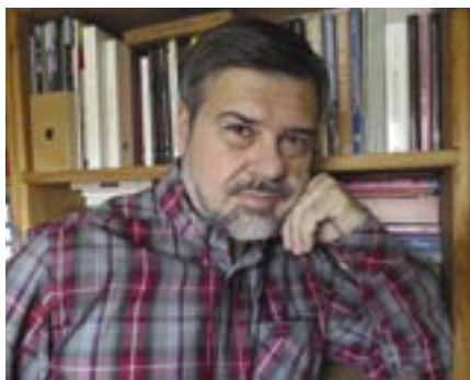
El filólogo y filósofo Enrique Gallud.