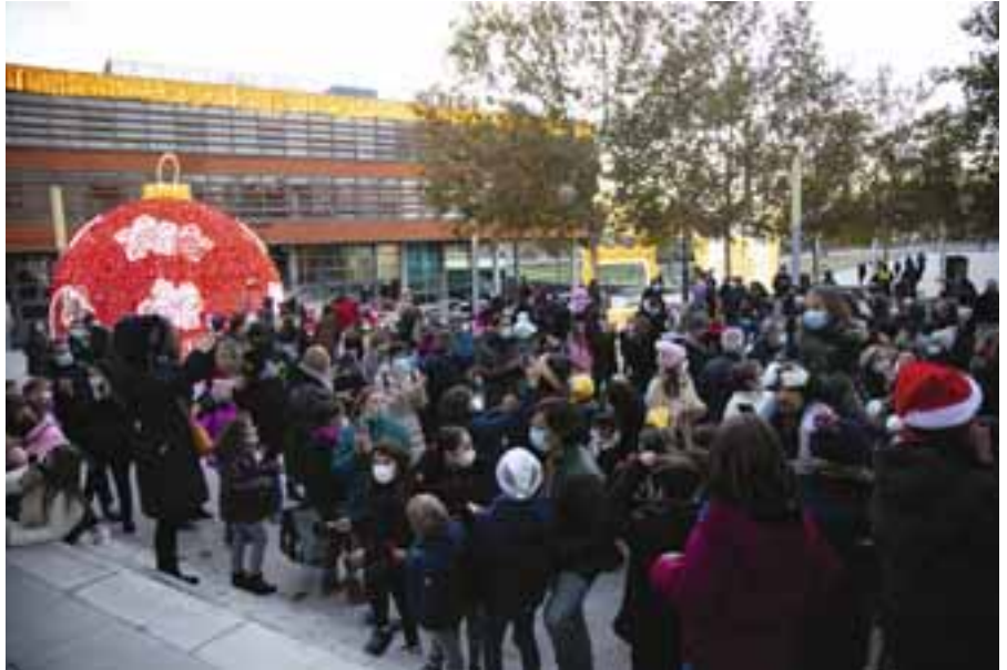
Acto de encendido navideño de 2021, en la plaza de la Constitución. Este año habrá actividades desde las 16.00. Las luces se encienden a las 18.00.

El Ayuntamiento y el tejido comercial han comenzado a trabajar en el diseño