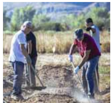
Agricultores de la finca Soto del Grillo. M.F.T.

Las personas interesadas pueden apuntarse a través de la web municipal inscripciones.rivasciudad.es . Este curso se enmarca en el décimo aniversario del parque agroecológico y forma parte del Plan de Economía Circular 'Con R de Rivas'. En los contenidos del curso figuran temas como: beneficios del compostaje, herramientas recomendadas, qué se puede aportar al compost y qué no, relación carbono-