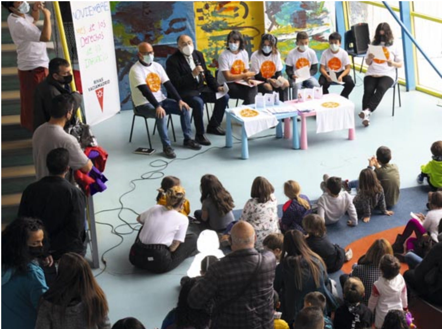
Un momento de la celebración del pasado Mes de los Derechos de la Infancia, en noviembre de 2021.