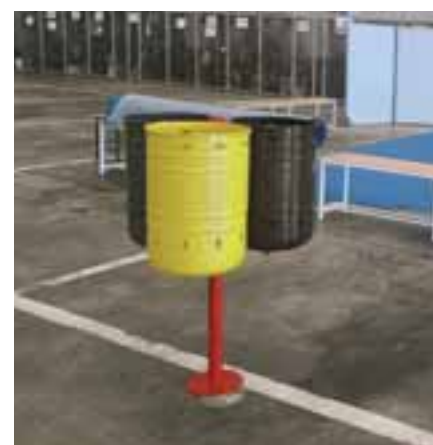
Prototipo de papeleras segregadas.

- Barrio Centro: parques infantiles de la avenida de Aurelio Álvarez, entre las