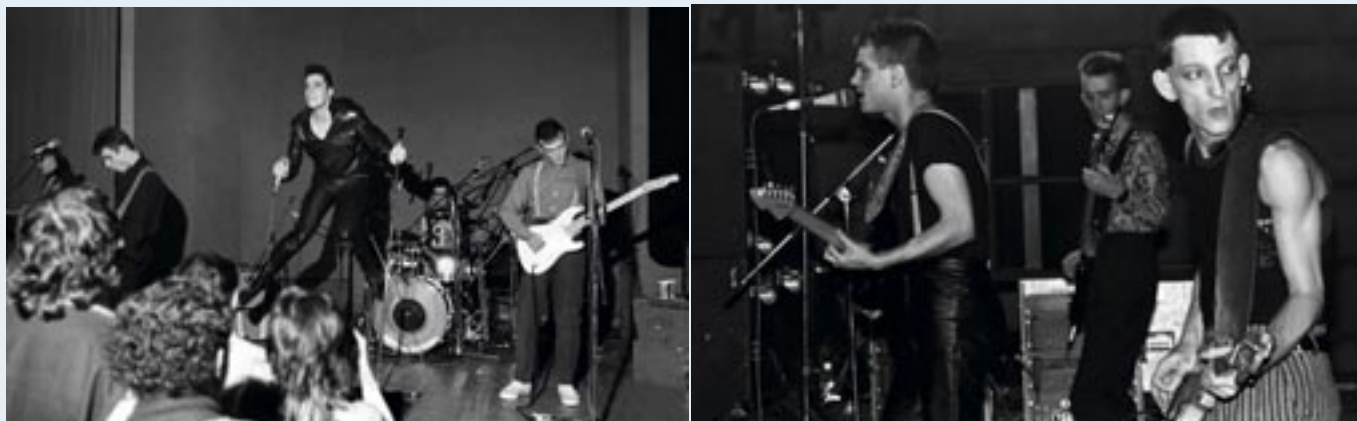
Izquierda: Loquillo y Los Trogloditas, en 1983. Derecha: Radio Futura, con Santiago y Luis Auserón y Enrique Sierra, en 1985.