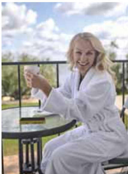
El café, infusión buena para la salud.

Organizado por la Universidad Alfonso X El Sabio, con la colaboración de la Concejalía de Salud Pública y Protección Animal, el encuentro se enmarca en la 22ª Semana de la Ciencia y la Innovación de Madrid. La empresa conCAFÉ mostrará las diferencias entre un café comercial y un café de