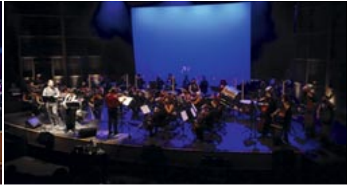
Las orquestas de la Universidad Rey Juan Carlos y la ripense Athanor, anfitriona del encuentro.