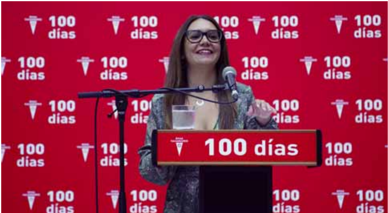
Acto de los 100 días al frente de la Alcaldía del pasado domingo 23 de octubre.