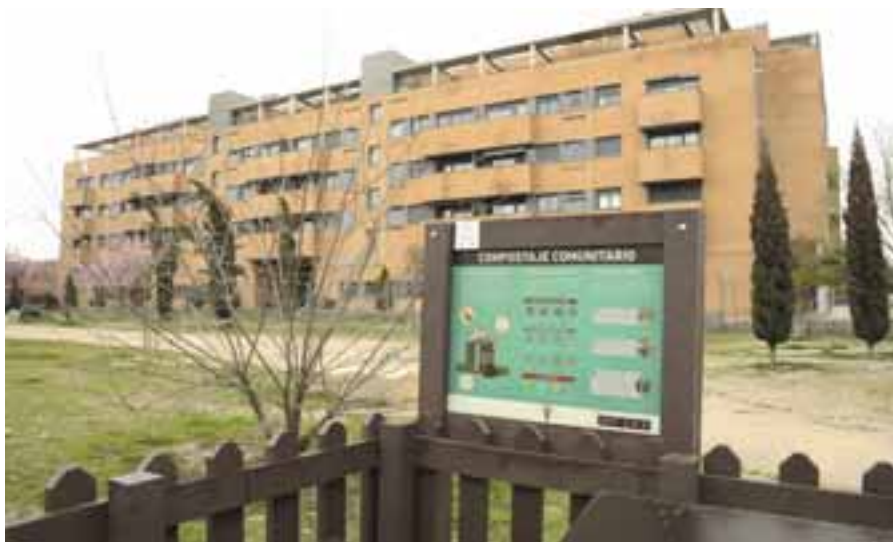
Las dos composteras activas están en la avenida de José Hierro y el barrio de La Luna. PACO MARISCAL

ECONOMÍA CIRCULAR → La ciudad cuenta con dos zonas activas y abre próximamente cuatro más: hay plazas disponibles en todas