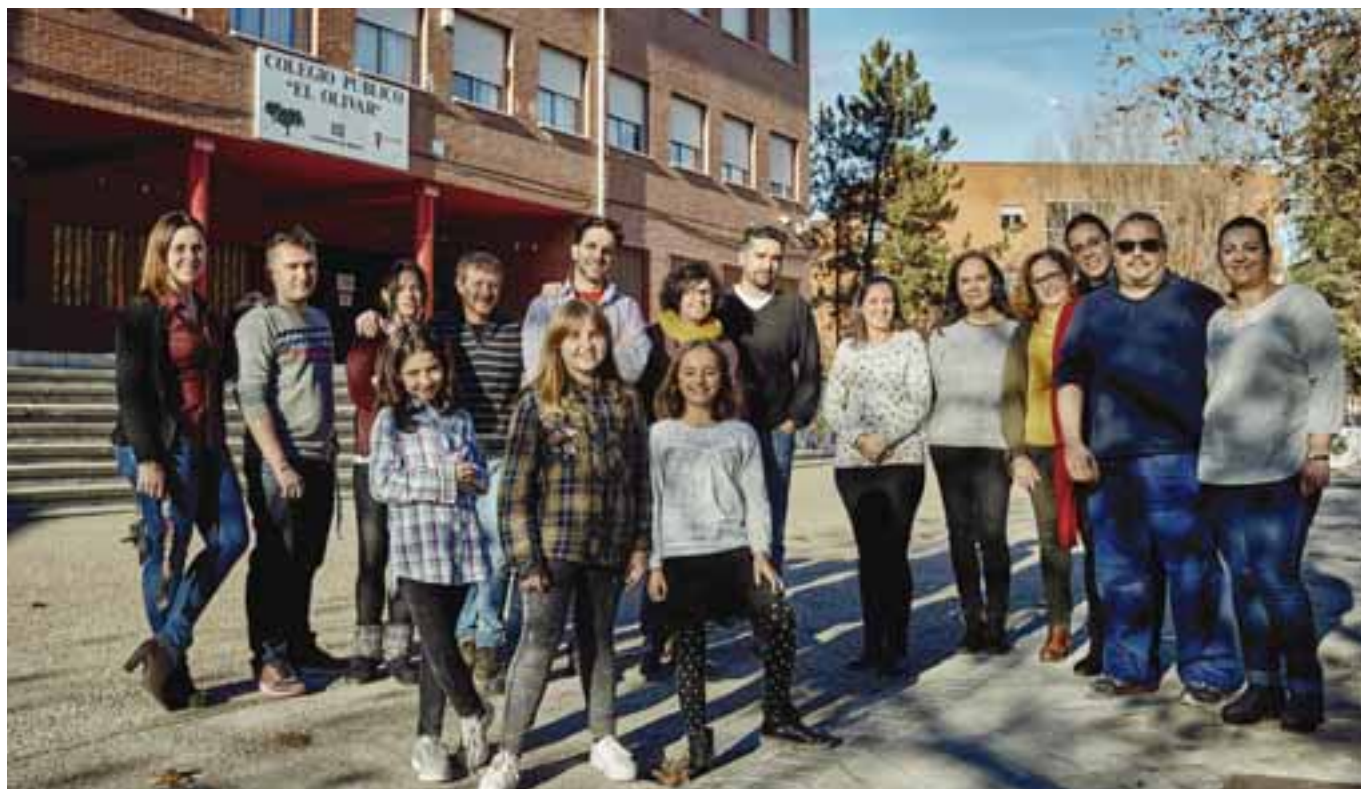
El colegio público El Olivar ha sido el que más ahorro energético ha conseguido en el curso 2021-2022, con 17.138 euros.