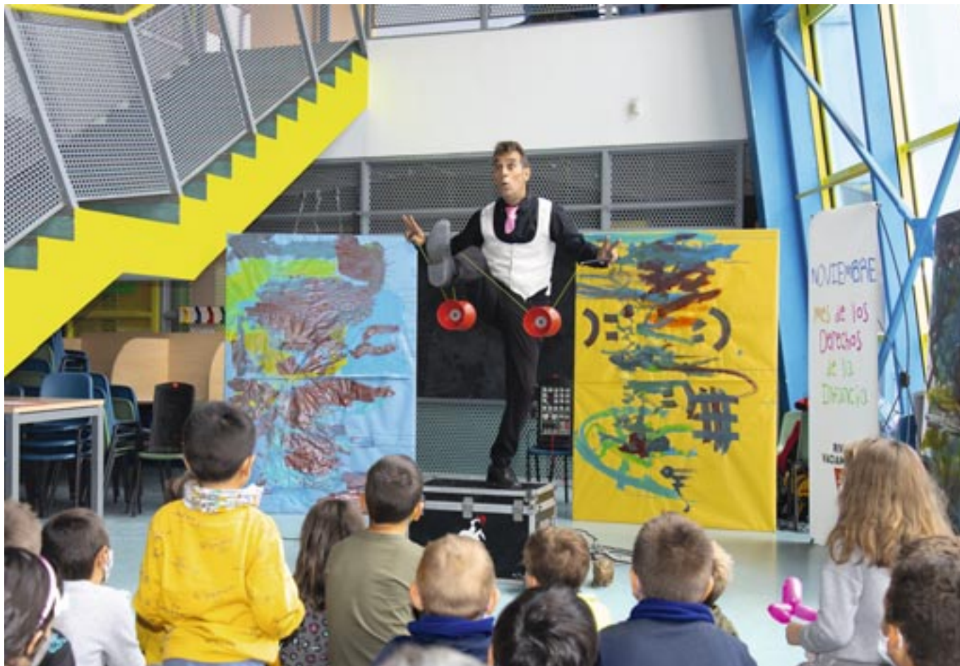
Rivas es Ciudad Amiga de la Infancia, distintivo que otorga Unicef, desde 2004.