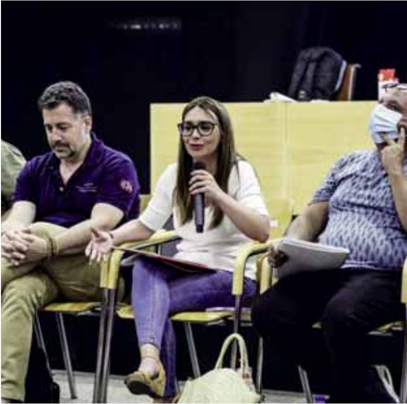
El primer acto como alcaldesa fue convocar el Consejo de Ciudad.

Metro en Los Berrocales, en un barrio de Madrid en el que todavía no vive nadie pero que permitirá a las constructoras aumentar el precio de sus viviendas. Queda claro que esto no es un problema de financiación sino de discriminación y negocio.