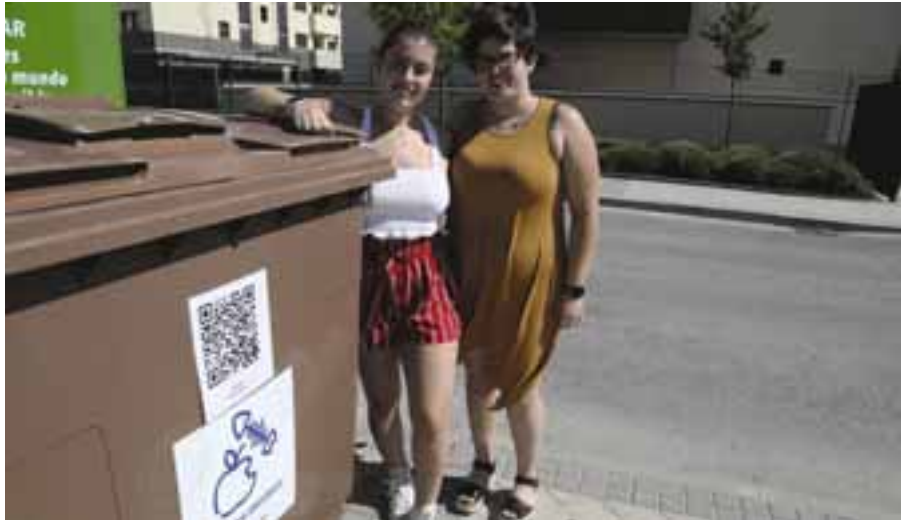
Más de 1.700 viviendas ya utilizan el cubo marrón del quinto contenedor.