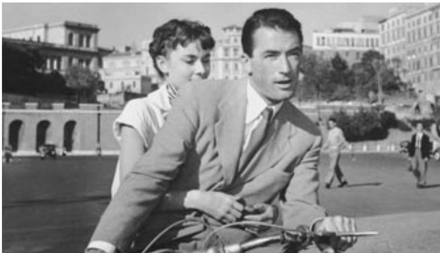
Audrey Hepburn y Gregory Peck, en la película 'Vacaciones en Roma'.