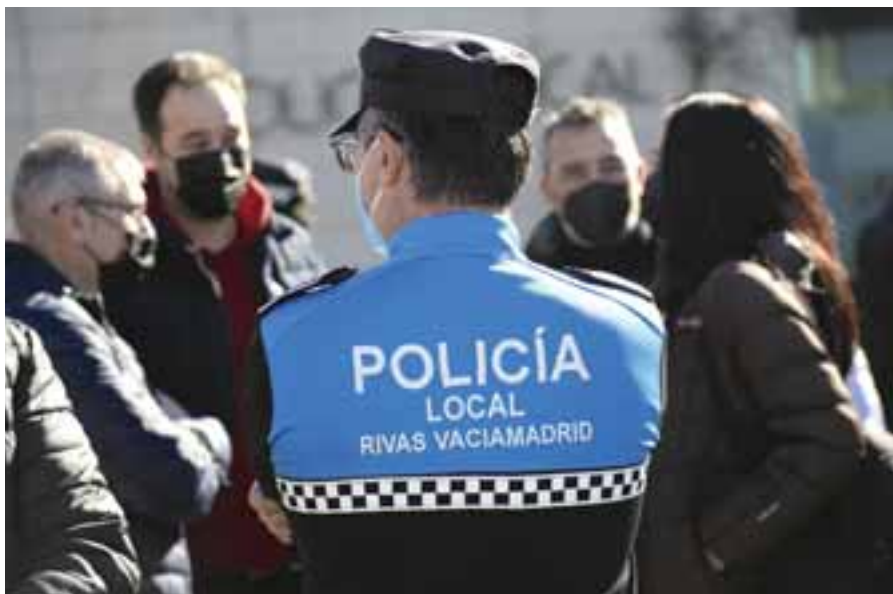
La formación está organizada por la Concejalía de Feminismos y Diversidad. PUBLIO DE LA VEGA

SEGURIDAD CIUDADANA → Agentes del cuerpo municipal reciben nueva formación en la materia