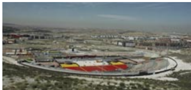
Imagen aérea del entorno del recinto ferial y auditorio Miguel Ríos.

Solicitudes y más información, en la web escuelacristinarota.com .