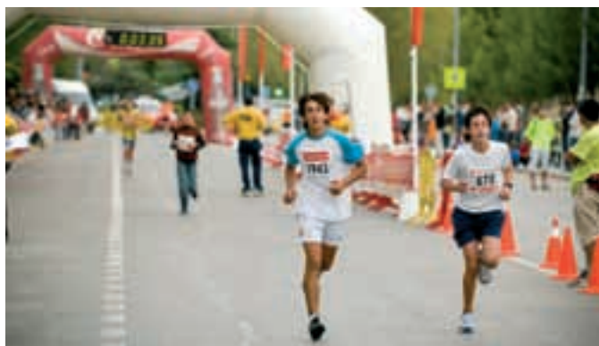
Diversos momentos de la Milla Urbana de Rivas de 2008. Se trata de una cita que reúnen a cientos de participantes. JESÚS PÉREZ.