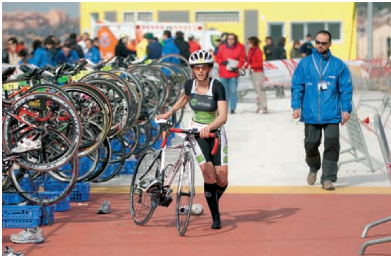
El recinto ferial del auditorio Miguel Ríos alberga el cuarto Duatlón Popular de Rivas. JESÚS PÉREZ.