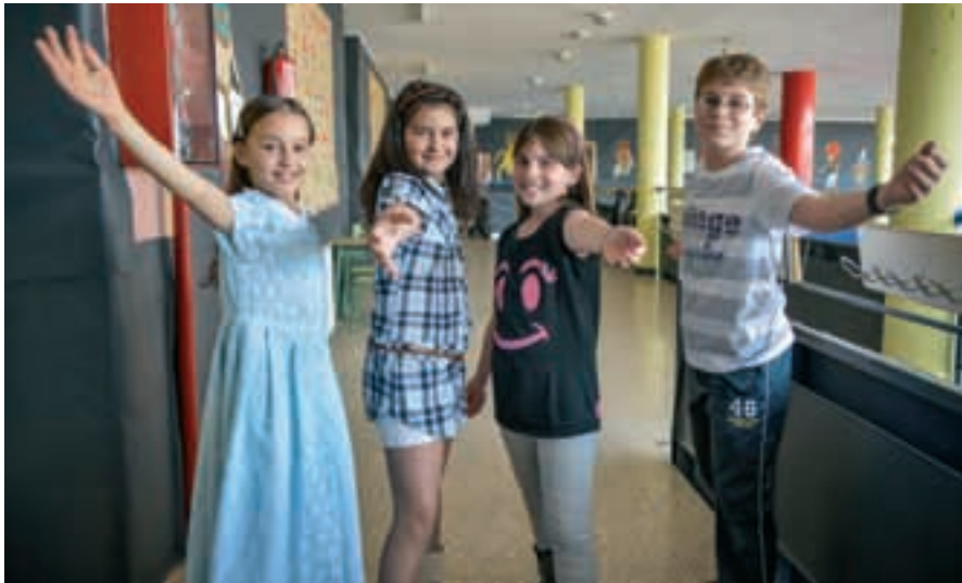
Alumnado del colegio Mario Benedetti durante una actividad escolar.