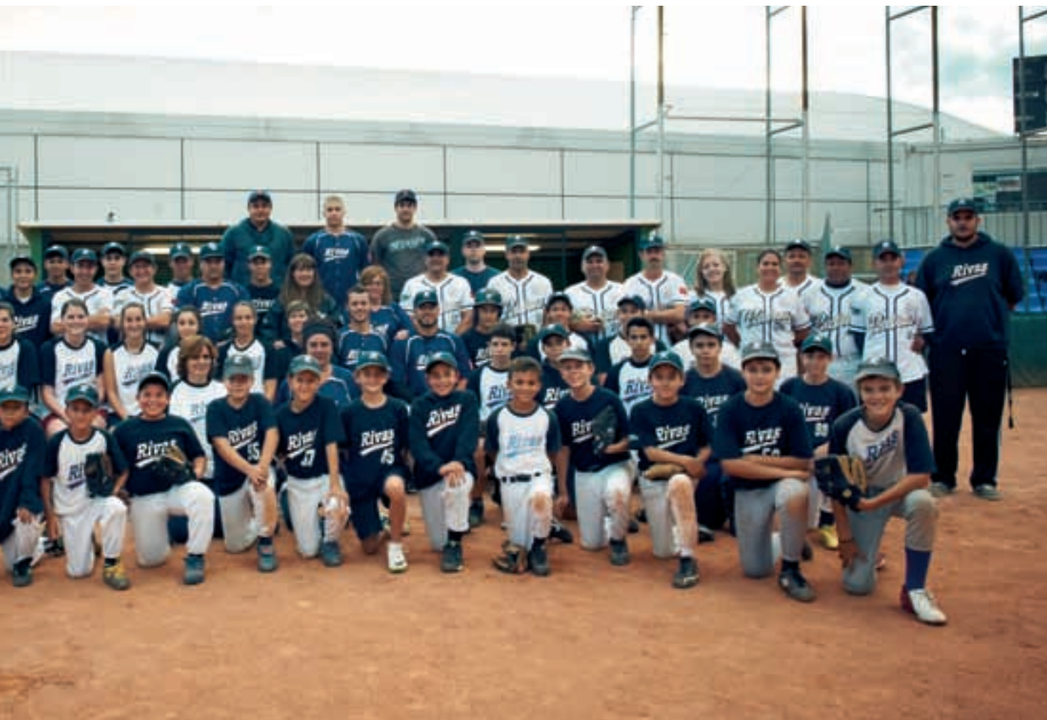
Integrantes del CBS Rivas, en el campo de sófbol del polideportivo Cerro del Telégrafo, el pasado viernes 19 de septiembre, por la tarde.

terreno de hierba para afrontar la División de Honor. El elevado coste de la operación, estimado en su día en 600.000 euros, es lo que ha impedido materializarlo.