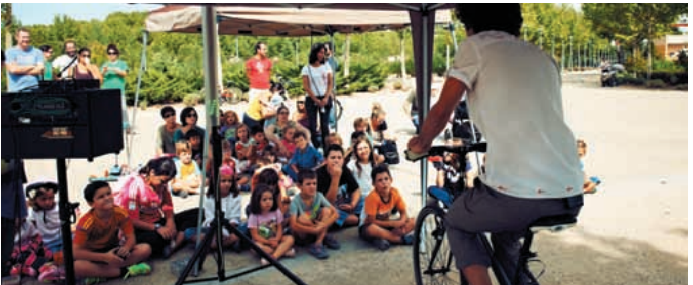
Taller sobre movilidad sostenible celebrado en la avenida del Cerro del Telégrafo.

Además de las reparaciones en calles, también se está trabajando en la actualización de señalética horizontal como pasos de peatones, líneas de carretera y demás señales.