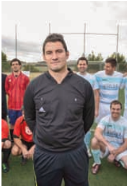
Un árbitro de la liga municipal de fútbol 11.

A estas competiciones futboleras, se suman el centenar y medio de inscritos en los rankings de tenis (8 grupos de ocho jugadores) y pádel (ocho grupos de seis parejas cada uno), que ya comenzaron sus competiciones.