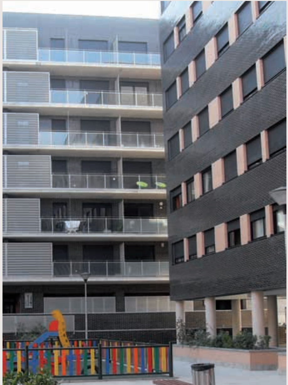
En Rivas se han construido 3.000 viviendas públicas en la última década.

Alquileres por tramos para inquilinos. Con el objetivo de evitar los impagos y de gestionar las deudas de las personas que arriendan pisos de la EMV, se estudiará cada caso y se adaptará la cuantía del alquiler a las limi-