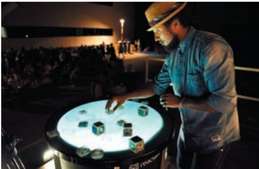
Concierto reactable, durante la inauguración del CEI, el pasado 19 de septiembre.

AUTOEMPLEO → Talleres tecnológicos, música y charlas se sucedieron en la jornada inaugural de este espacio para fomentar el autoempleo