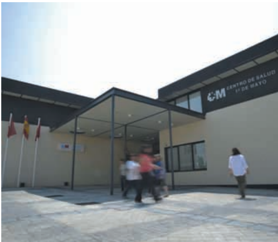
El centro de salud 1º de Mayo, que abrió sus puertas en junio de 2013.

SALUD → Rivas reclama a la Comunidad de Madrid este traslado para que la ciudadanía pueda ser atendida en su propio municipio