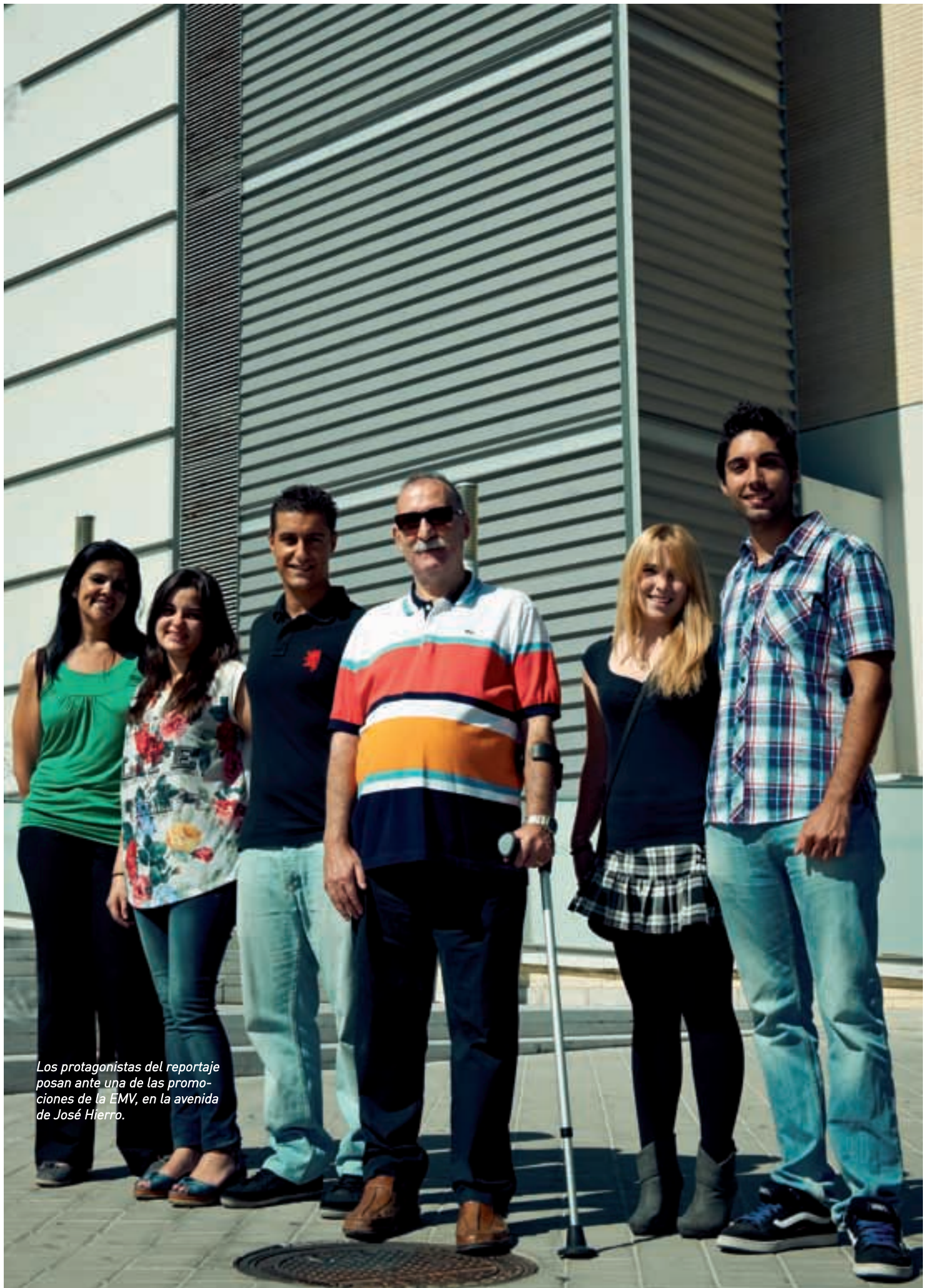
Los protagonistas del reportaje posan ante una de las promociones de la EMV, en la avenida de José Hierro.