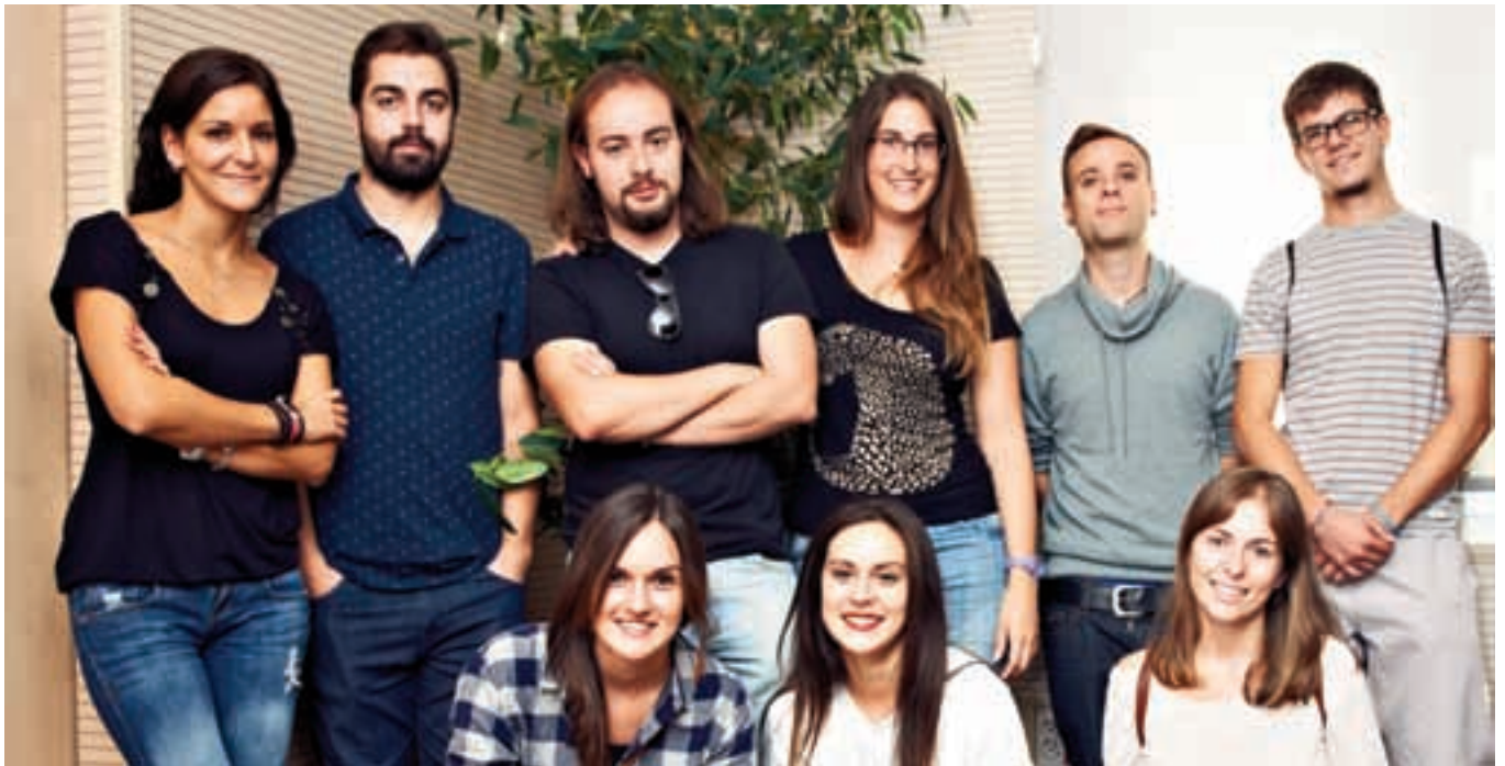
Nueve de los trece jóvenes ripenses beneficiarios de las Becas Leonardo.