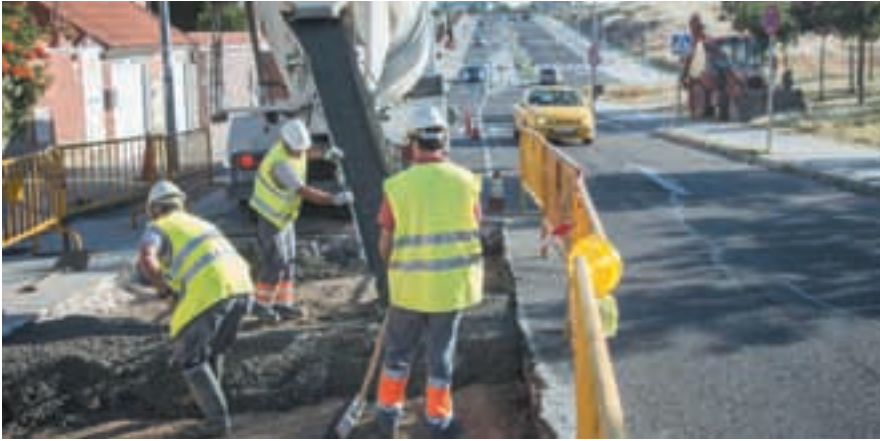
Trabajos de reparación de firme en una calle del municipio.