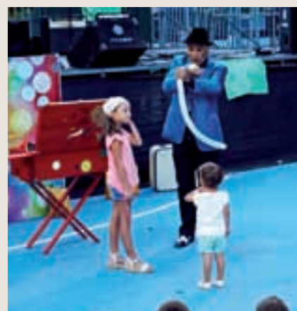
El Barrio de La Luna celebró sus fiestas preparadas por los vecinos y vecinas.