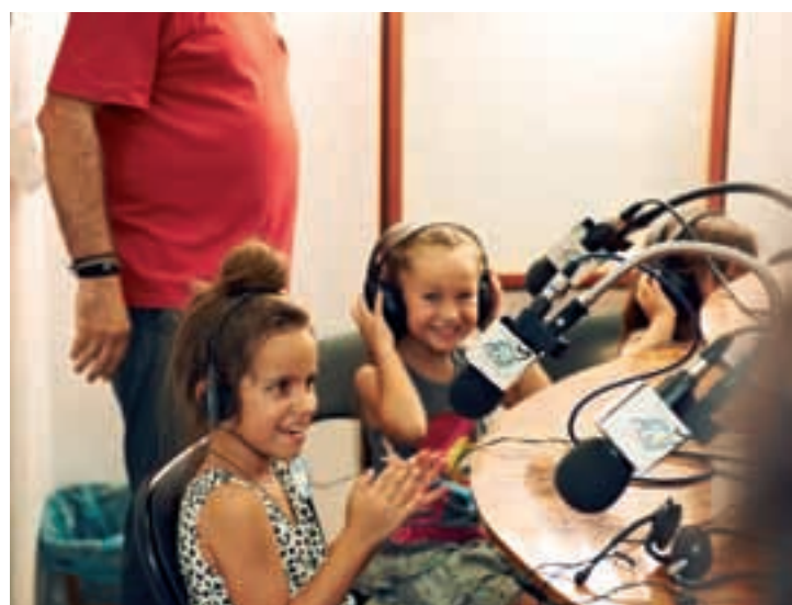
Imágenes de la Fiesta Solidaria por Gaza que se realizó en Barrio de Pablo Iglesias.